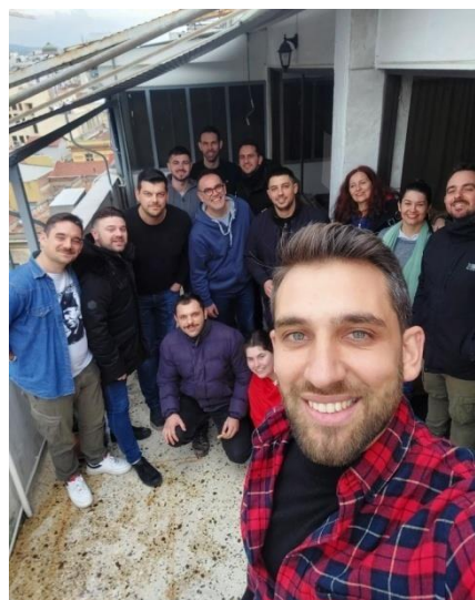
Εικόνα 1 Μετά την πρόβα στο Χορόδεντρο 14-1-2023