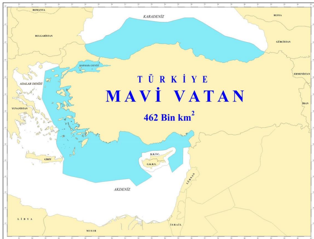
Εικόνα 2: Ο χάρτης της «Γαλάζιας Πατρίδας»

Οι φιλόδοξες, όμως, τουρκικές προθέσεις για αναβίωση του μεγαλείου της οθωμανικής εποχής απαιτούσαν και μια αλλαγή στη στρατηγική κουλτούρα. Το επόμενο κεφάλαιο εξετάζει ακριβώς αυτή την αλλαγή στρατηγικής της Τουρκίας, που επήλθε ως απόρροια της προσπάθειάς της να πραγματώσει το νέο γεωπολιτικό της όραμα, ρέποντας προς τον αναθεωρητισμό και τη χρήση σκληρής ισχύος· προσπάθεια που βρίσκεται ακόμη σε εξέλιξη.