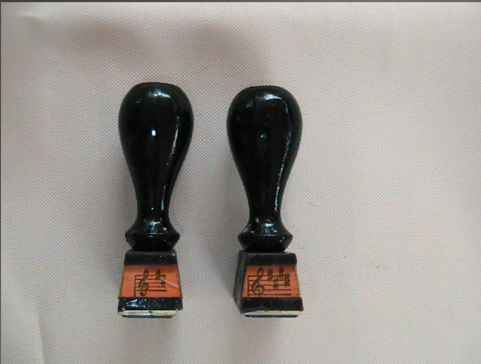
Σφραγίδες. Δείγμα των εργαλείων που χρησιμοποιούσε ο Σαχινίδης για την αναπαραγωγή καθαρών αντιγράφων των έργων του.