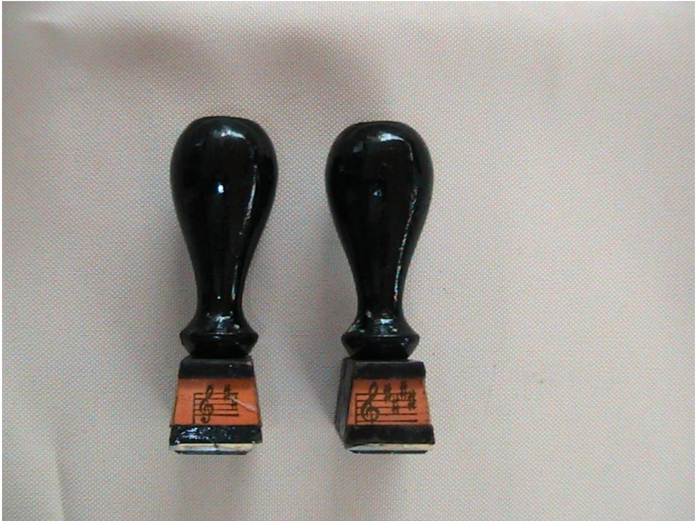
Εικόνα 13: Σφραγίδες. Δείγμα των εργαλείων που χρησιμοποιούσε ο Σαχινίδης για την αναπαραγωγή καθαρών αντιγράφων των έργων του.