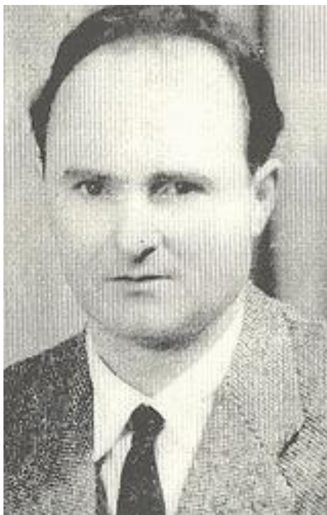
Εικόνα 1: Γεώργιος Σαχινίδης. 2

Πολλοί αξιόλογοι έλληνες μουσικοί εκτελεστές και συνθέτες, έχουν διακριθεί διεθνώς για το έργο τους, συνδυάζοντας την ελληνική μουσική παράδοση με άλλες μουσικές παραδόσεις και κουλτούρες. Το έργο τους ανέδειξε την ελληνική μουσική συνδιάζοντας την ελληνική μουσική παράδοση με άλλες μουσικές παραδόσεις και κουλτούρες. Μεταξύ αυτών βρίσκεται ο συνθέτης και σαξοφωνίστας, Γεώργιος Σαχινίδης. Η παρούσα Μεταπτυχιακή Διπλωματική Εργασία πραγματεύεται θέματα τα οποία αφορούν στη ζωή και το μουσικό/καλλιτεχνικό έργο του.