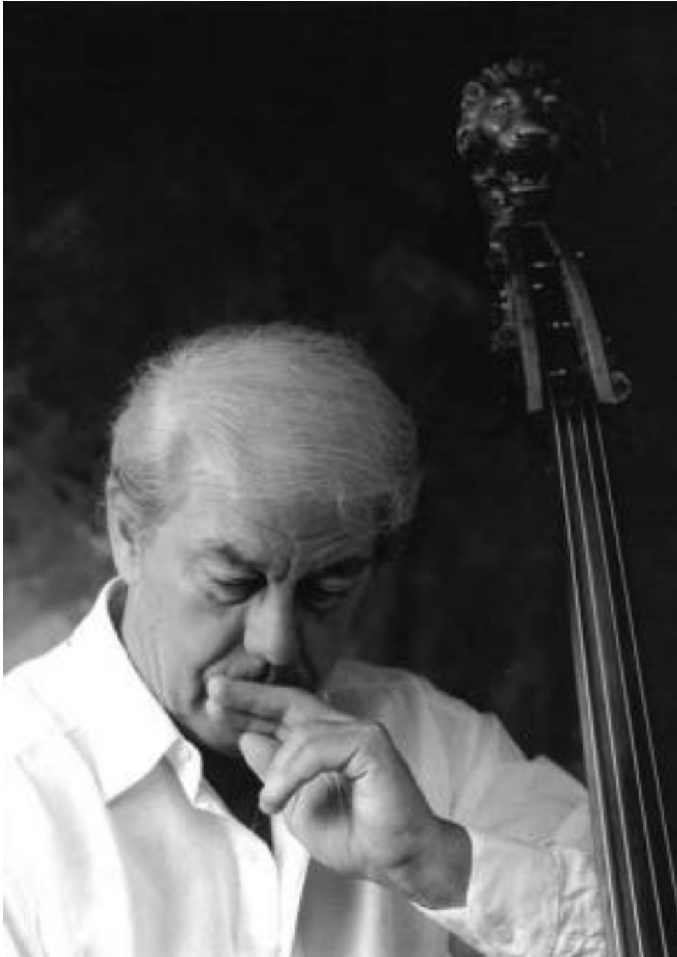
Εικόνα 5: Jean-Marc Rollez. 18 (η φωτογραφία είναι της Anita Nouteau).

να διδάσκει και να δίνει ρεσιτάλ και συναυλίες σε όλον τον κόσμο. Πέθανε στις 7 Αυγούστου του 2020 σε ηλικία 89 ετών. 17