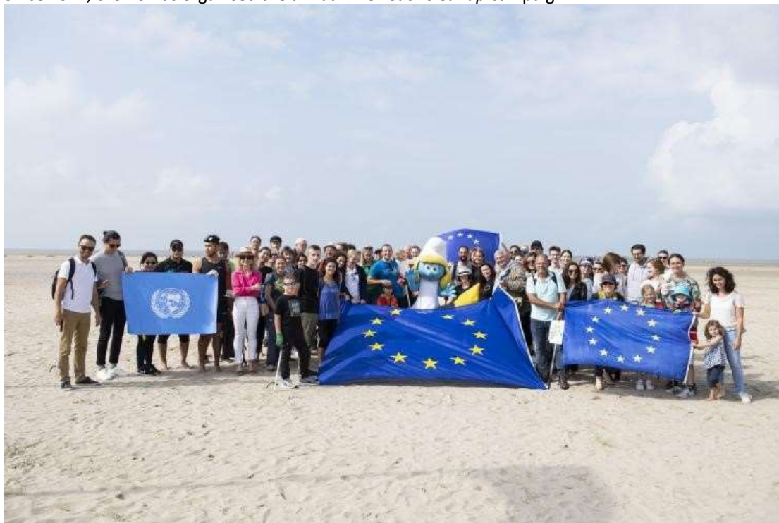
Εικόνα 4: From the heart of Europe to the world. Since 2017, the EU has organised the annual #EUBeachCleanup campaign.