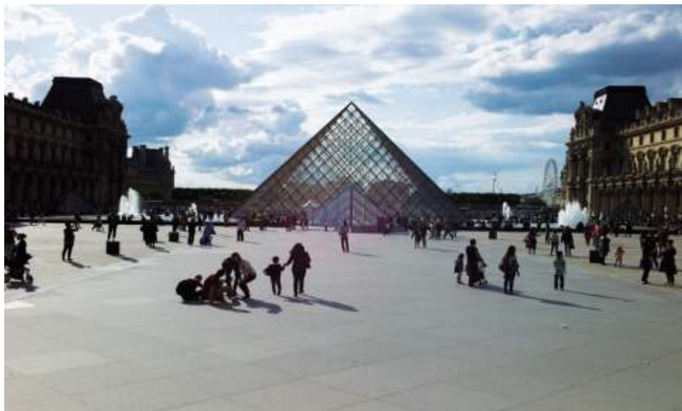
Εικόνα 1: Το Λούβρο στο Παρίσι, το πρώτο σε επισκεψιμότητα μουσείο στον κόσμο.