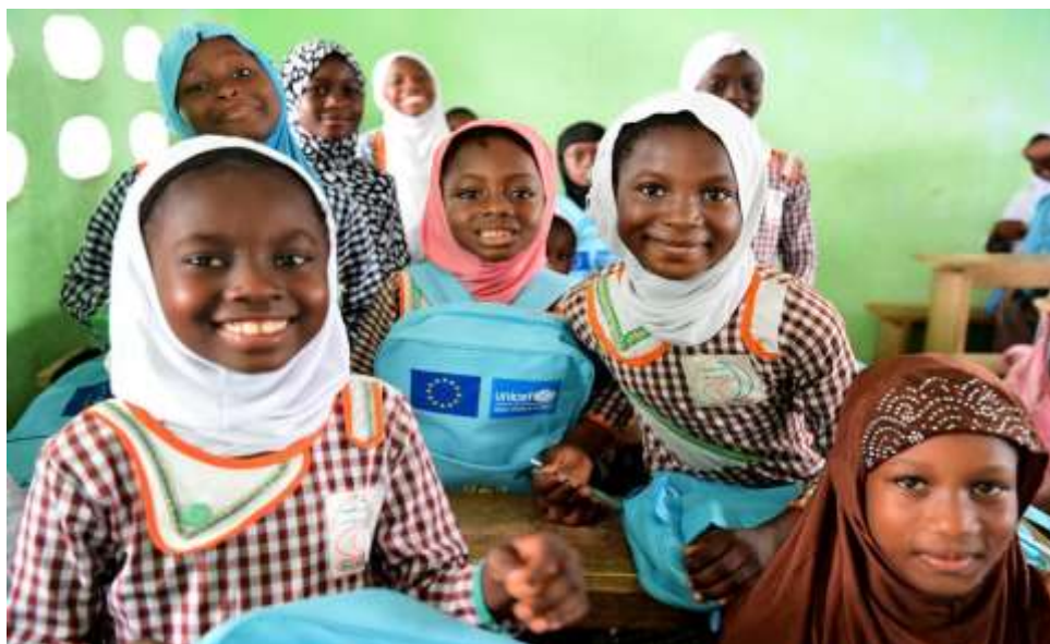
Εικόνα 5: the EU Strategy on the Rights of the Child

Παράλληλα, τα εκπαιδευτικά προγράμματα Erasmus Mundus, αλλά και αυτά της βασικής εκπαίδευσης που χρηματοδοτούνται από την Ε.Ε. και εφαρμόζονται μεθοδικά σε τρίτες χώρες (σε Ασία, Αφρική κ.λπ.), 205 ανεξάρτητα από το επίπεδο ανάπτυξής τους, μπορούν να επηρεάσουν τους θεσμούς και τη διοίκηση των χωρών αυτών με στελέχη που έχουν λάβει ευρωπαϊκή εκπαίδευση. Και το σημαντικότερο, ίσως, είναι ότι, αφού εξοικειωθούν οι νέοι με τον ευρωπαϊκό πολιτισμό και τις ευρωπαϊκές αξίες, θα ενσωματωθούν κοινωνικά και πολιτισμικά ευκολότερα, σε περίπτωση που μεταναστεύσουν μελλοντικά στην Ευρώπη ως εργαζόμενοι ή σπουδαστές. Από αυτήν την άποψη, πρόκειται για πολύ σημαντική επένδυση της Ε.Ε., τόσο για την πορεία προς την ανάπτυξη των τοπικών κοινωνιών και των δημοκρατικών θεσμών, όσο και για το όφελος που θα έχει η ίδια η Ευρώπη, καθώς το πρόβλημα της υπογεννητικότητας σε μια ήπειρο που γερνάει θα καταστήσει μονόδρομο την υποδοχή μεταναστών από τρίτες χώρες, ενώ οι ροές τους θα συνεχίσουν να αυξάνονται τις προσεχείς δεκαετίες.