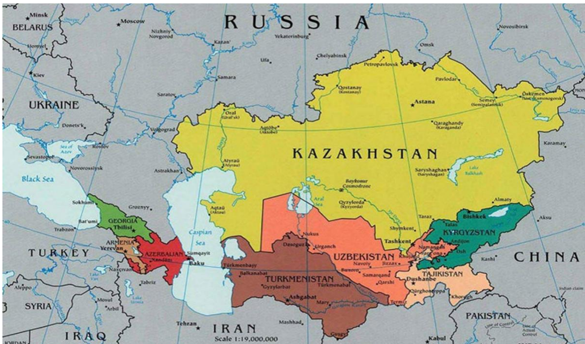
Χάρτης 1: Χάρτης των κρατών της Κεντρικής Ασίας, (πηγή: https://maps-kazakhstan.com/map-of-kazakhstan-and-surrounding-countries ).

Ακόμη, σημαντικός παράγοντας για τη μελέτη των σημερινών σχέσεων των κρατών αυτών της Κεντρικής Ασίας με άλλες δυνάμεις στην περιοχή αποτελεί και το γεγονός πως μόνο η ελίτ, άρα, μία μικρή μερίδα του πληθυσμού που δεν είναι ρωσικής καταγωγής μιλούσε και χρησιμοποιούσε πέραν του επίσημου επιπέδου (δημόσια διοίκηση) τη ρωσική γλώσσα. Ο πληθυσμός διαδραματίζει επίσης καίριο ρόλο, αφού, ανάλογα με την επιρροή που έχει ασκήσει μία ξένη δύναμη στην κουλτούρα και την κατάσταση του πληθυσμού διαμορφώνεται και η στάση της κοινής γνώμης και η πολιτική του κράτους. Για παράδειγμα, στο Καζακστάν, ένα μεγάλο ποσοστό του πληθυσμού αυτοπροσδιορίζονται ως «Ρώσοι» ενώ λόγω του γεγονότος πως το έθνος κράτος αυτό συνορεύει με τη Ρωσία, υπάρχουν διλήμματα ασφαλείας στην περιοχή καθώς υφίστανται εντάσεις ανάμεσα στα μέλη της κοινωνίας (Allison & Jonson, 2004, σ. 8).