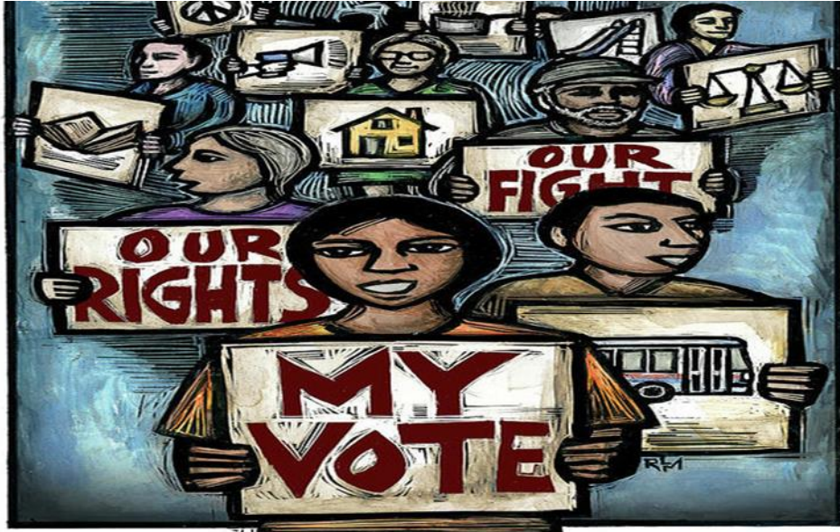
Εικόνα 2 Ricardo Levins Morales