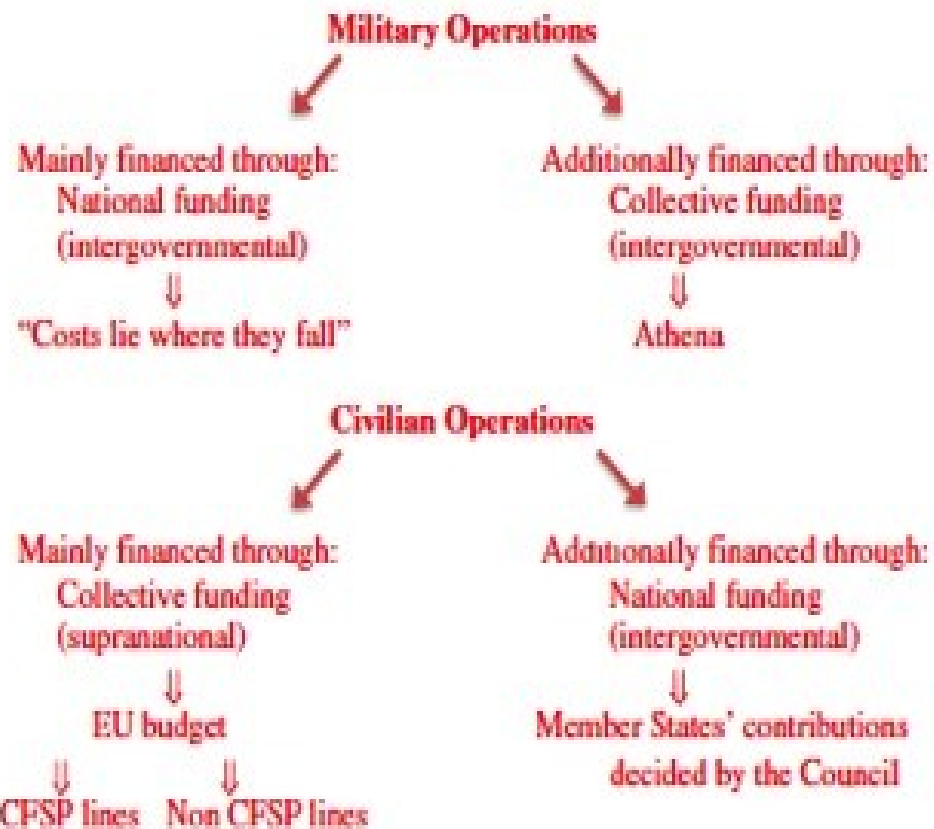
Figure 2. Fragmentation in financing CSDP operations.