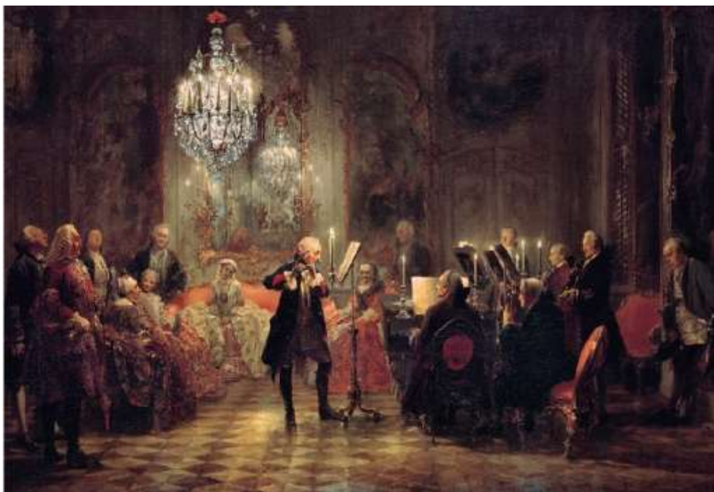
Εικόνα 10. Adolph Menzel, Frederick the Great Playing the Flute at Sanssouci . Πηγή: shorturl.at/mBG37 .

Προς το τέλος του 18 ο αιώνα, το μουσικό style που επικράτησε στην Ευρώπη ήταν το κλασικό. Το style που επικρατούσε μέχρι τότε, το rococo, ανταποκρινόταν στα συγκεκριμένα ακούσματα και τις εκδηλώσεις των αριστοκρατών, κάτι για το οποίο μάλιστα παραπονιόταν συχνά ο Mozart. Σχεδόν όλα τα μουσικά style είχαν αφηθεί στο περιθώριο με σκοπό την αναζήτηση ενός καινούριου, φυσικού μουσικού style. Η καινούρια μουσική εκτός από την σχέση της με τη φύση, έπρεπε να έχει νόημα και να είναι όμορφη για τους ακροατές, ενώ ταυτόχρονα κάθε μουσικό κομμάτι έπρεπε να διαφέρει από το άλλο. Μέσα απ' αυτά τα στοιχεία δημιουργήθηκε έτσι μια μουσική με δημοκρατική μορφή προς τους ακροατές, μορφωμένους ή όχι, η οποία ταίριαζε στην καινούρια καθημερινότητα του 18 ου αιώνα.