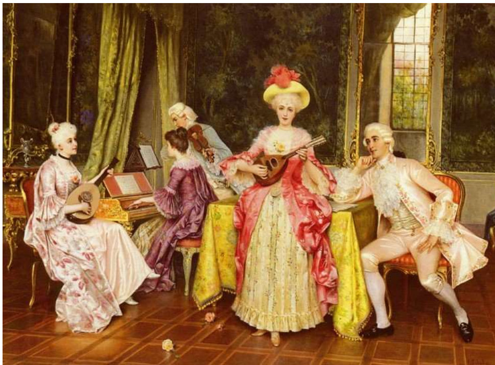
Εικόνα 11. Sabatini, The music Lesson .

Όσον αφορά τη μουσική πρακτική, κατά τον 18 ο αιώνα παρατηρείται η εμφάνιση ενός πολύ σημαντικού θεσμού, της Δημόσιας συναυλίας, κάτι που έδινε το δικαίωμα σε περισσότερο κόσμο να παρακολουθεί συναυλίες και έμμεσα, να μορφώνεται. Σημαντικός παράγοντας για την εμφάνιση της Δημόσιας συναυλίας ήταν η καινούρια κουλτούρα που προσπάθησε να διαδώσει στην κοινωνία το κίνημα του Διαφωτισμού, όπως επίσης και η άνοδος της μεσαίας τάξης, που πλέον είχε το δικαίωμα και την οικονομική ευχέρεια να συμμετέχει πιο ενεργά στην πολιτική αλλά και τα δρώμενα της κοινωνίας γενικότερα. 85 Παίρνοντας μέρος σε τέτοιες συναυλίες, ο κόσμος ξεκίνησε να έχει ενδιαφέρον για την δική του μουσική μόρφωση. Μεγάλωσε έτσι ο αριθμός ανθρώπων οι οποίοι ασχολούνταν με τη μουσική χωρίς να είναι επαγγελματίες. Εμφανίστηκαν έτσι πολλοί ερασιτέχνες μουσικοί που τους άρεσε είτε να παίζουν όργανο είτε να τραγουδούν. Προήλθε έτσι και η ανάγκη για την έκδοση μουσικών βιβλίων, μεθόδων αλλά και πολλών παρτιτουρών για να μπορούν οι ερασιτέχνες μουσικοί να μελετούν και να μαθαίνουν μουσική στα σπίτια τους.