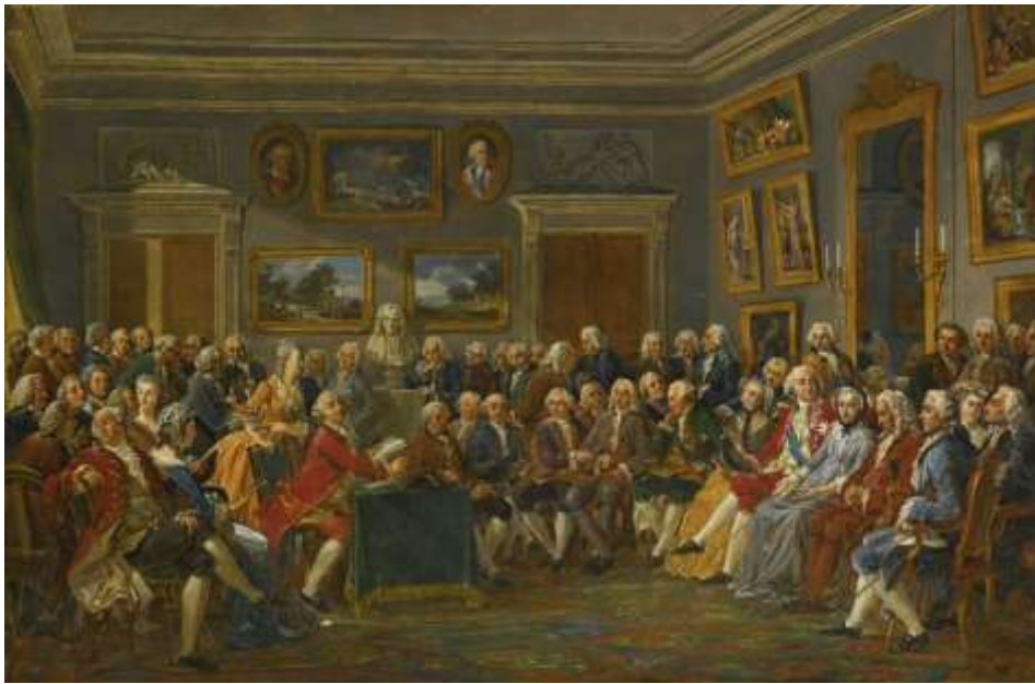
Εικόνα 6. Anicet-Charles-Gabriel Lemonnier (1743-1824), A reading of Voltaire's tragedy "L' Orpheline de la Chine" in the salon of Madame Geoffrin.

Οι κλάδοι της επιστήμης δεν ήταν πάντα όπως τους γνωρίζουμε σήμερα. Πολλά ονόματα σημερινών επιστημών είχαν εντελώς διαφορετική σημασία κατά τον 18 ο αιώνα. Για παράδειγμα ο όρος φυσική τον 18 ο αιώνα περιελάβανε γνώσεις ιατρικής ενώ αυτό που σήμερα ονομάζουμε φυσική αποκαλούνταν κατά τον 18 ο αιώνα ως μικτά μαθηματικά . Οι επιστήμες και οι κατηγοριοποιήσεις τους άρχισαν να παίρνουν την σημερινή τους μορφή τον 18 ο αιώνα. Αυτό θεωρείται ίσως η πιο σημαντική συμβολή του Διαφωτισμού στον τομέα της επιστημονικής ανάπτυξης. 57 Επιπρόσθετα, σημαντική ήταν η συμβολή του Διαφωτισμού στην ανάπτυξη πολλών ανθρωπιστικών επιστημών. Οι Διαφωτιστές ήθελαν να χρησιμοποιήσουν την καινούρια γνώση γύρω από τις καινούριες επιστήμες προς όφελος της ευτυχίας του ανθρώπου. Μέσα από αυτό επιστήμες όπως τα οικονομικά, γλωσσολογία, ιστορία και πολιτική άρχισαν να δημιουργούνται. Οι φιλόσοφοι που ασχολήθηκαν με αυτές τις επιστήμες ήταν συγκεκριμένα οι Φρανσουά Κενέ (Francois Quesnay, 1694-1774) και Άνταμ Σμιθ (Adam Smith, 1723-1790) στα οικονομικά, ο Ρουσσώ στην γλωσσολογία, ο Βολταίρος και ο Γουίλιαμ Ρόμπερτσον (William Robertson, 1721-1793) στην Ιστορία, και ο Μοντεσκιέ μαζί με τον Ρουσσώ στην πολιτική. 58