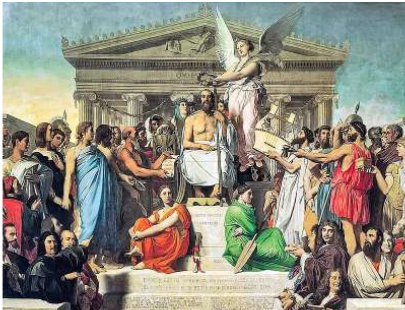
Εικόνα 8. Jean-Auguste-Dominique Ingres, Η αποθέωση του Ομήρου .

Ο πιο σημαντικός ζωγράφος του Νεοκλασικισμού είναι ο Ζακ-Λουί Νταβίντ (Jacques-Louis David, 1748-1825). Εκτός από την πορεία του ως καλλιτέχνης, ασχολήθηκε ενεργά και με την πολιτική. Συγκεκριμένα έλαβε μέρος στη Γαλλική Επανάσταση και ήταν μέλος της Λέσχης των Ιακωβίνων. Το πιο σημαντικό έργο του ήταν Ο όρκος των Ορατίων , έργο μεγάλης σημασίας του Νεοκλασικισμού μέσα στο οποίο προβάλλονται αρχές όπως η “πολιτική αρετή”, ο πατριωτισμός και ο πόθος για ελευθερία της πατρίδας. Σημαντικός ζωγράφος της εποχής ήταν επίσης ο Ζαν Ωγκύστ-Ντομινίκ Ένγκρ (Jean-Auguste-Dominique Ingres, 1780-1867), μαθητής του David. Τα πιο σημαντικά του έργα τα οποία ακολουθούν τα πρότυπα του Νεοκλασικισμού ήταν η Λουόμενη και Η αποθέωση του Ομήρου .