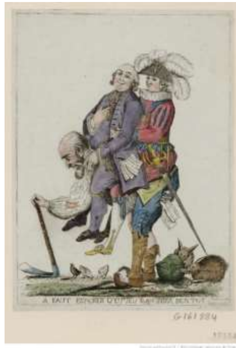
Εικόνα 1. The Third Estate carrying the Clergy and the Nobility on its back.

Μετά το τέλος των πολέμων της Ισπανικής Διαδοχής (1702-1713) και τη συνθήκη της Ουτρέχτης (1713), στο μεγαλύτερο μέρος της Ευρώπης επικρατούσε μια γενικώς ειρηνική κατάσταση χωρίς σημαντικές κοινωνικές εντάσεις. Αυτή η κατάσταση ανατράπηκε σύντομα με τους δύο πολέμους του 1740 και του 1756 οι οποίοι έφεραν έντονες κοινωνικές αναταραχές. Με την άνοδο της Πρωσίας, κράτος με μεγάλο στρατό, το 1740 ο Φρειδερίκος ο Μέγας, κατάφερε να κατακτήσει την Σιλεσία στον οκταετή πόλεμο της Αυστριακής διαδοχής. Τα δύο κράτη εξαντλήθηκαν ενώ παράλληλα η Αγγλία και η Γαλλία βρίσκονταν σε πόλεμο για τις αποικίες του Καναδά και της Ινδίας. Το 1756 σχηματίστηκε μια μεγάλη συμμαχία μεταξύ Αυστρίας, Ρωσίας και Σουηδίας με σκοπό την ανάκτηση της Σιλεσίας. Η Γαλλία εντάχθηκε στην συμμαχία με σκοπό την εκδίκηση της έναντι της Αγγλίας για την αποικιακή της ήττα. 9 Ο πόλεμος τελείωσε το 1763 με αποτέλεσμα να αναδειχτούν η Πρωσία