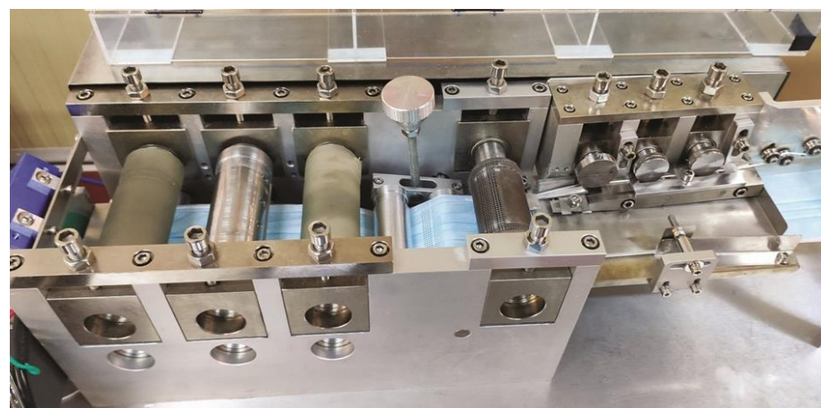
Τμήμα της γραμμής παραγωγής масκών στο εργοστάσιο του Ομίλου Πλαστικά Θράκης στην Ξάνθη.