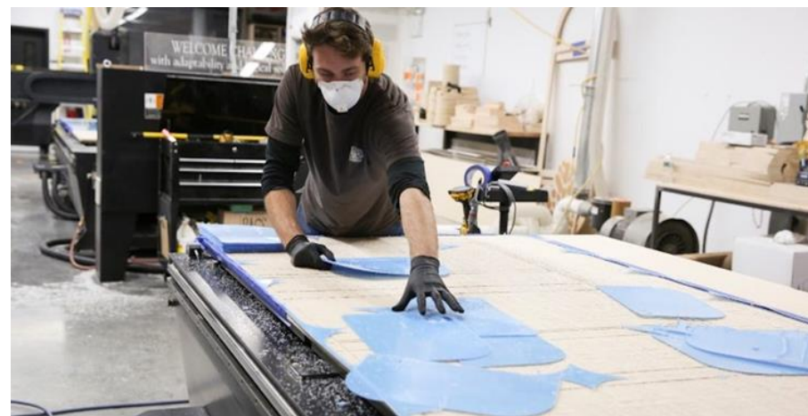
Brooklyn Navy Yard, αναδιοργάνωση παραγωγής εντός 48 ωρών. Ο χειριστής CNC παράγει προστατευτικές ιατρικές ασπίδες προσώπου.