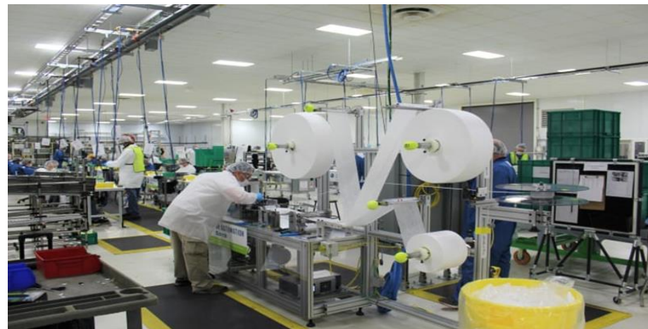
Γραμμή παραγωγής ιατρικών масκών. Μετασχηματισμός γραμμών παραγωγής της αυτοκινητοβιομηχανίας General Motors.