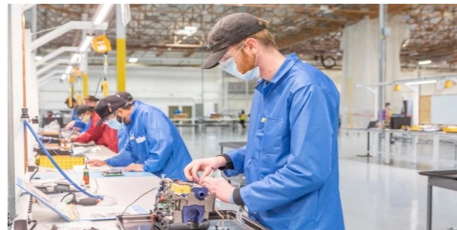
Hamilton Medical Inc Συναρμολόγηση ενός ιατρικού αναπνευστήρα που αναπτύχθηκε με τη συμβολή μηχανικών της αυτοκινητοβιομηχανίας General Motors στη Νεβάδα.