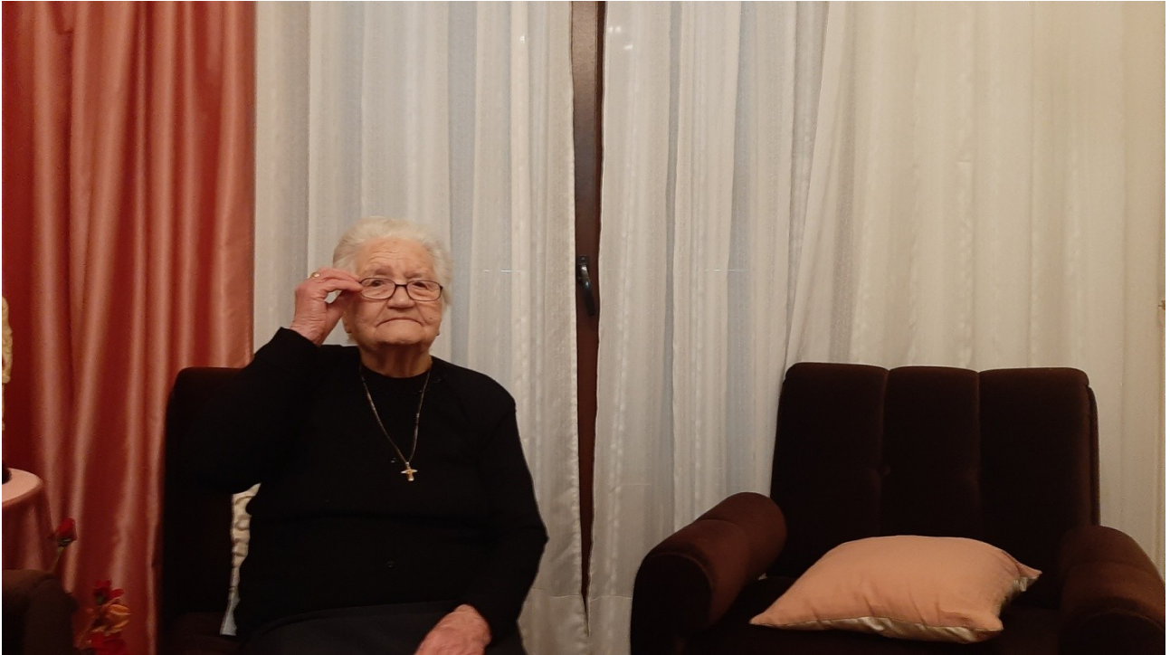
Η Γιαγιά Ελισάβετ κατά την διάρκεια της συνέντευξης