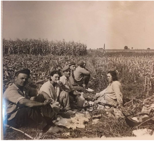
Ασχολίες Λιτοχωριτών( Κτηνοτροφία, υφαντουργία, αλιεία)