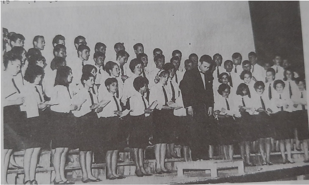
Μικτή χορωδία Σακελλαρίδη δημοτική Ιωάννη