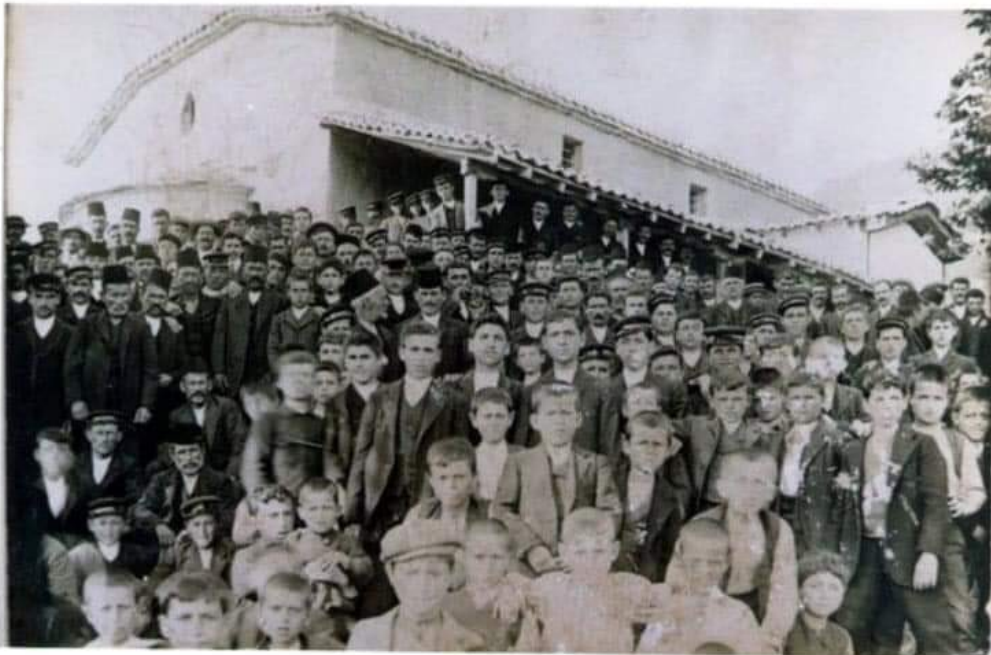
Γιορτή Αγίου Γεωργίου