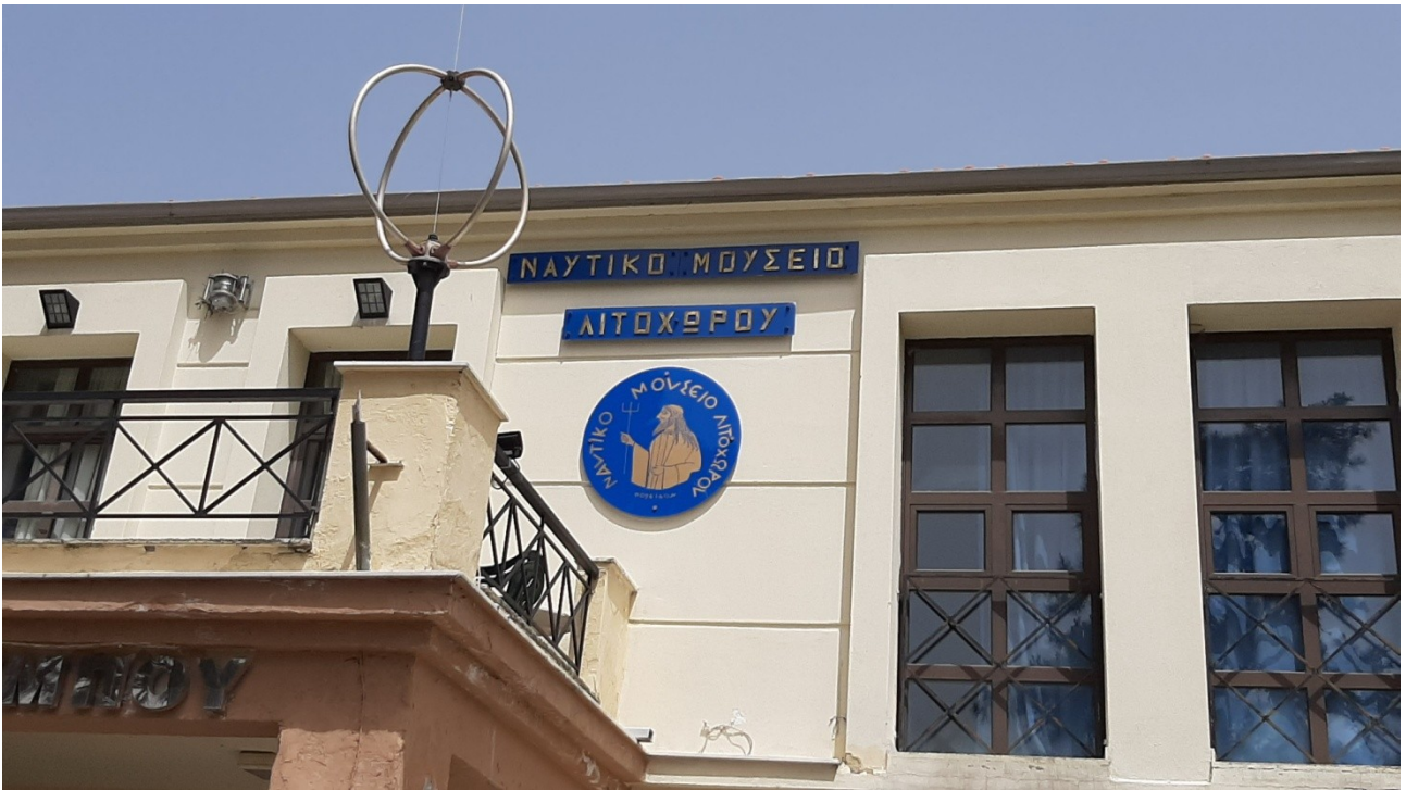
Ναυτικό Μουσείο Λιτοχώρου