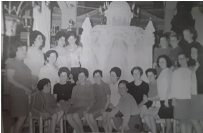
Κατά το στόλισμα του Επιταφίου τη Μ. Πέμπτη