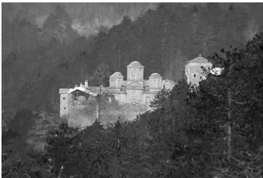
Παλαιό μοναστήρι Αγίου Διονυσίου του εν Ολύμπω