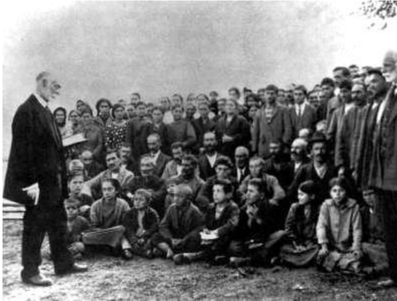
Εικόνα 1 Υπαίθρια λατρευτική συνάθροιση των Ευαγγελικών της Κατερίνης τα πρώτα χρόνια της εγκατάστασης