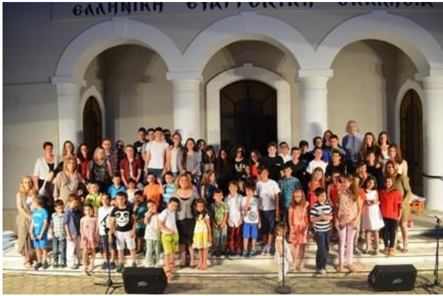
Εικόνα 13 Εκδήλωση Κυριακού Σχολείου στον προαύλιο χώρο του ευκτήριου οίκου