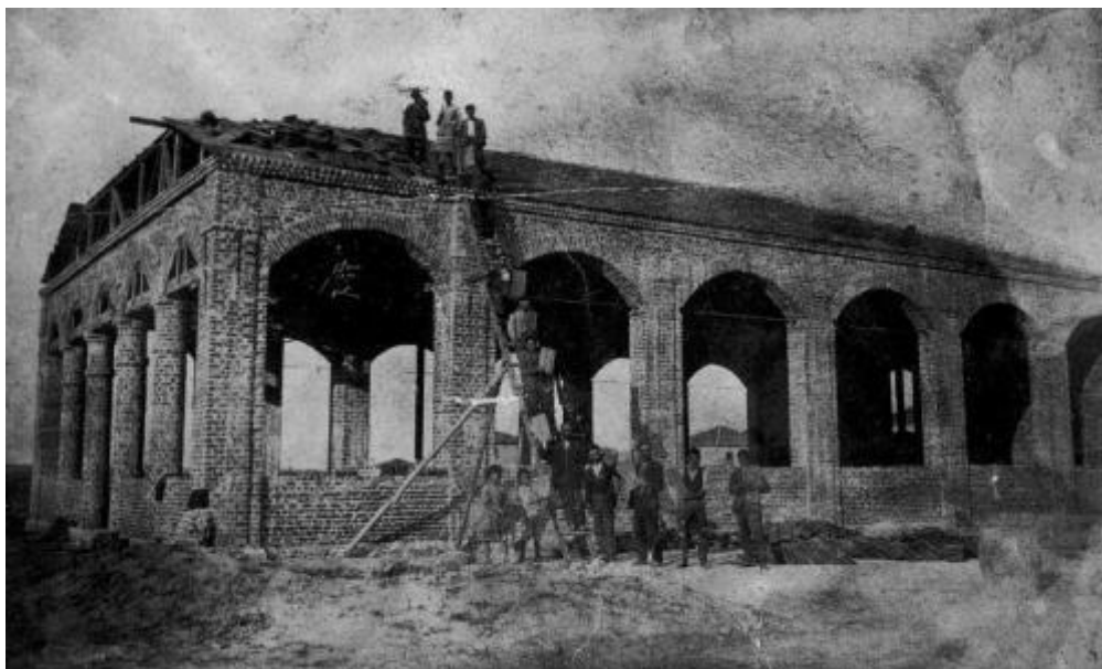
Εικόνα 2 Ο πρώτος ευκτήριος οίκος της Ευαγγελικής Εκκλησίας Κατερίνης κατά την περίοδο της οικοδόμησης (1925)