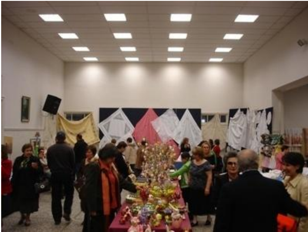
Εικόνα 11 Παζάρι της Φιλοπτώχου Αδερφότητας