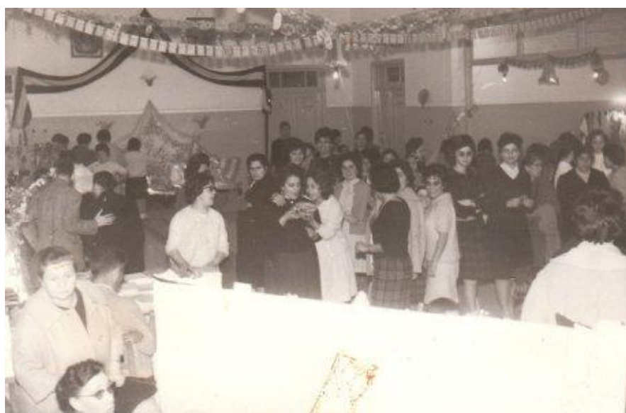
Εικόνα 4 Παζάρι της Φιλόπρωγου Αδερφότητας Κυριών