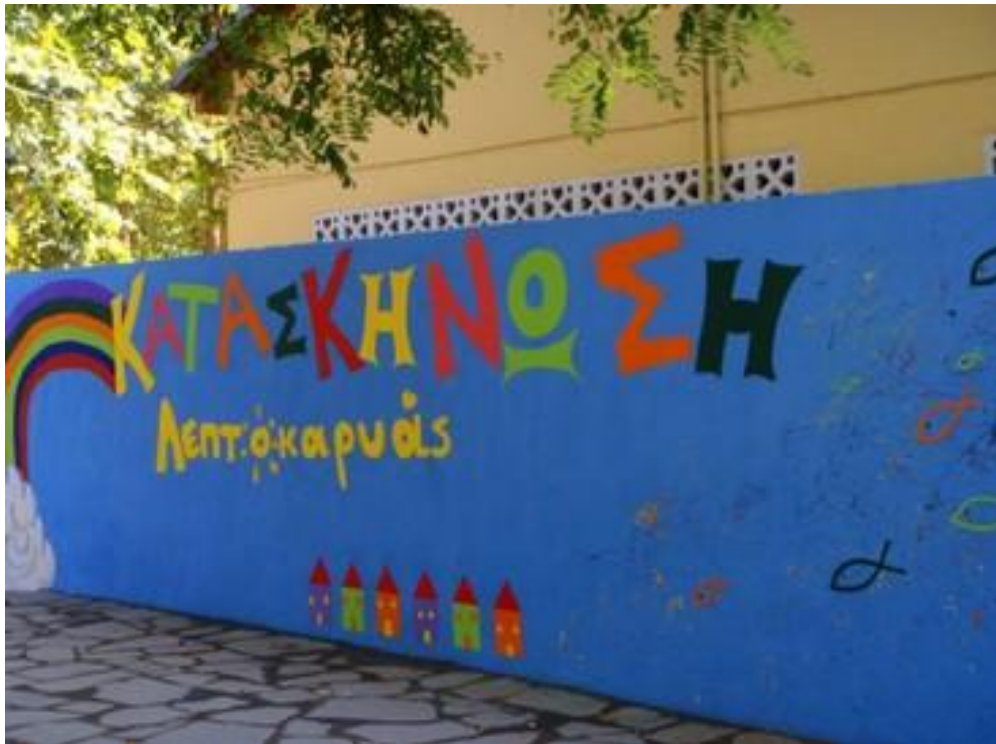
Εικόνα 12 Περίοδος παιδιών στην Κατασκήνωση Λεπτοκαρυάς