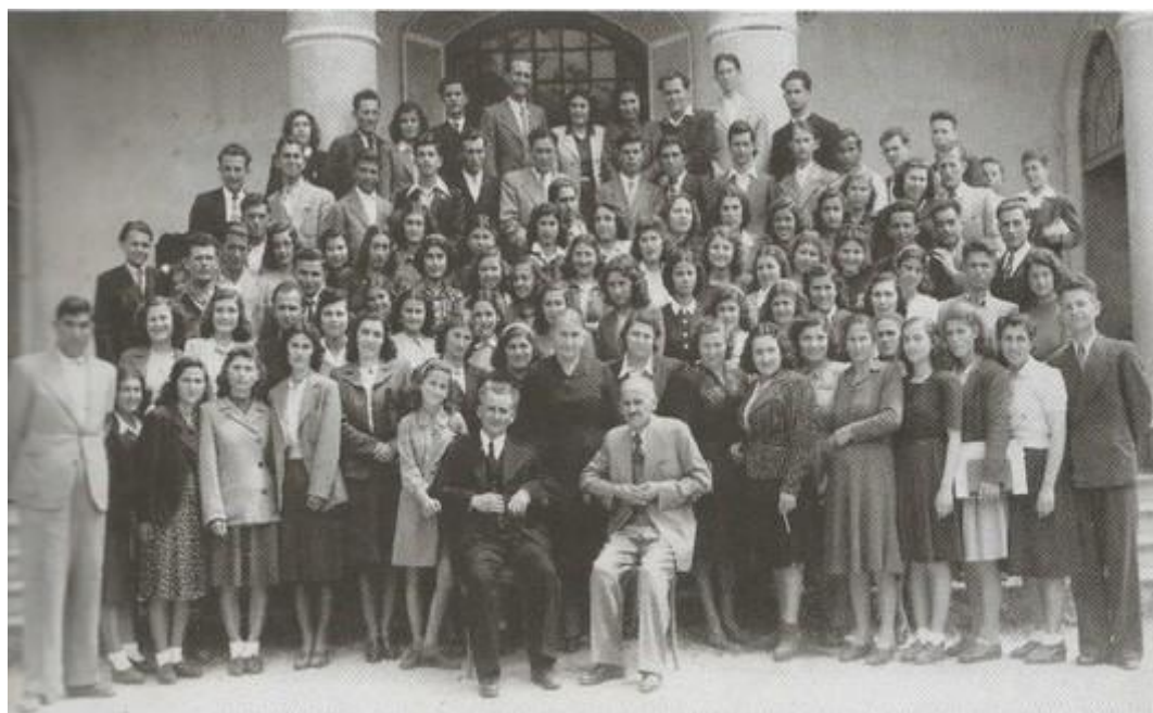
Εικόνα 6 Η Χορωδία της Ευαγγελικής Εκκλησίας (1940)