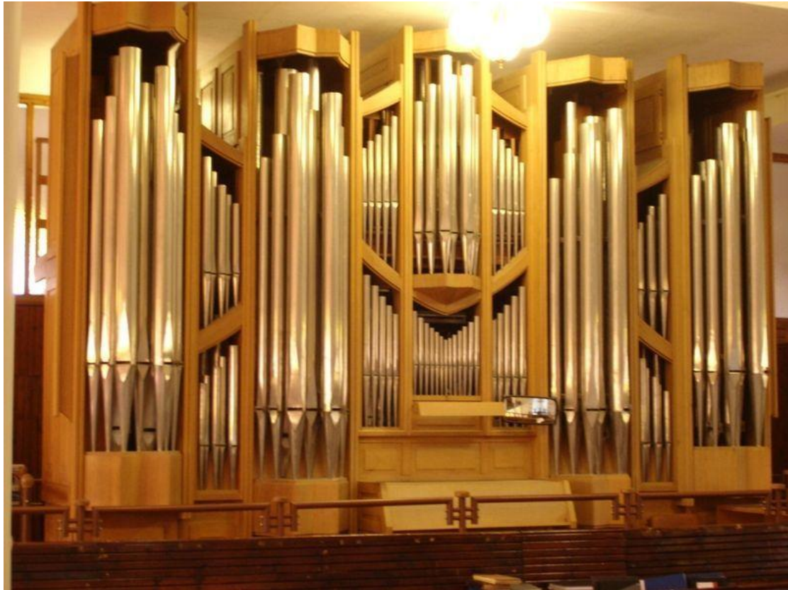
Εικόνα 9 Το εκκλησιαστικό όργανο της Εκκλησίας