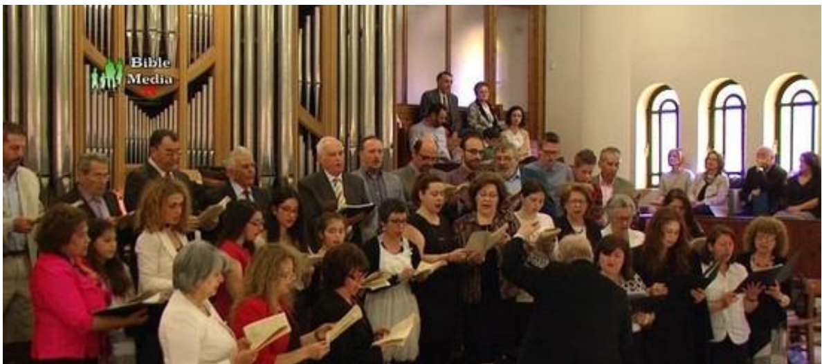
Εικόνα 8 Η Χορωδία της Ευαγγελικής Εκκλησίας (Σήμερα)