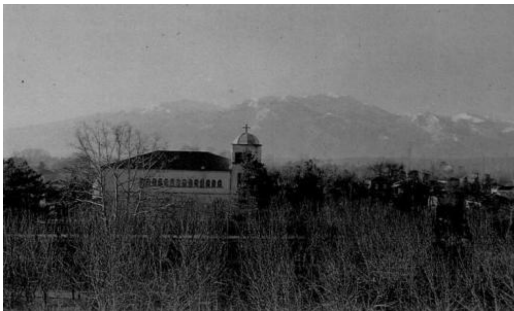
Εικόνα 3 Το πάρκο του Συνοικισμού Ευαγγελικών, το κτίριο της εκκλησίας και στο βάθος ο Όλυμπος (δεκαετία 1950)