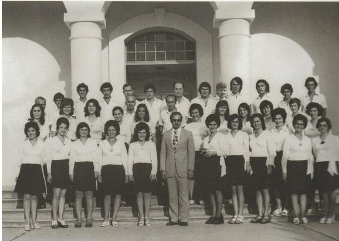
Εικόνα 7 Η Χορωδία της Ευαγγελικής Εκκλησίας (1973)