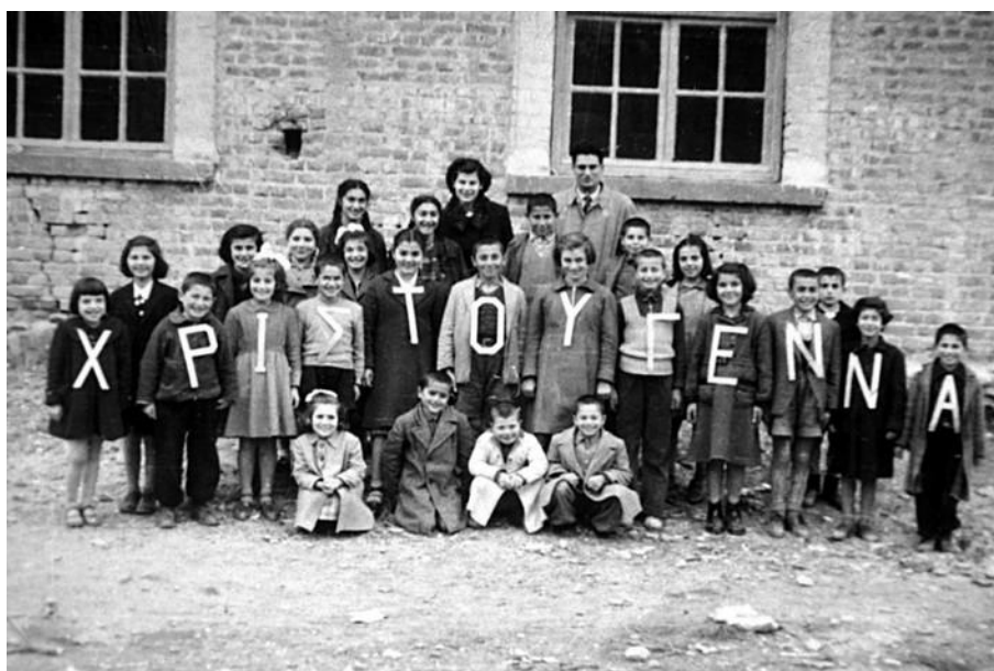
Εικόνα 5 Τα παιδιά του Ορφανοτροφείου τα Χριστούγεννα του 1953