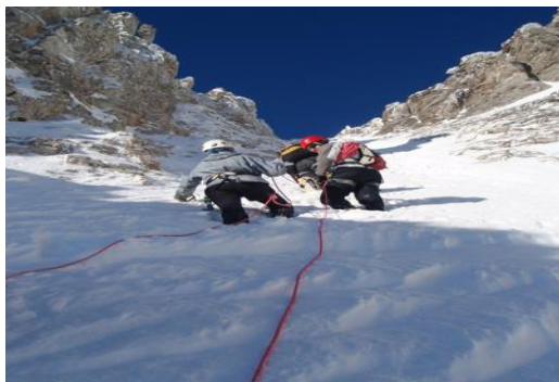
Αναρρίχηση στον Όλυμπο