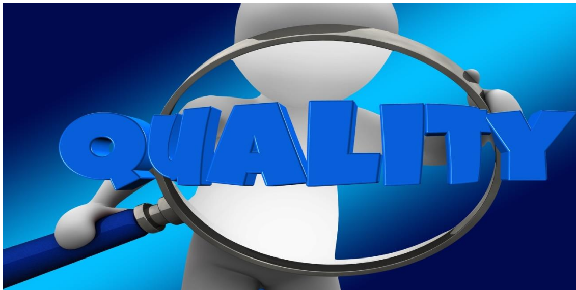
Εικόνα 4: Ποιότητα