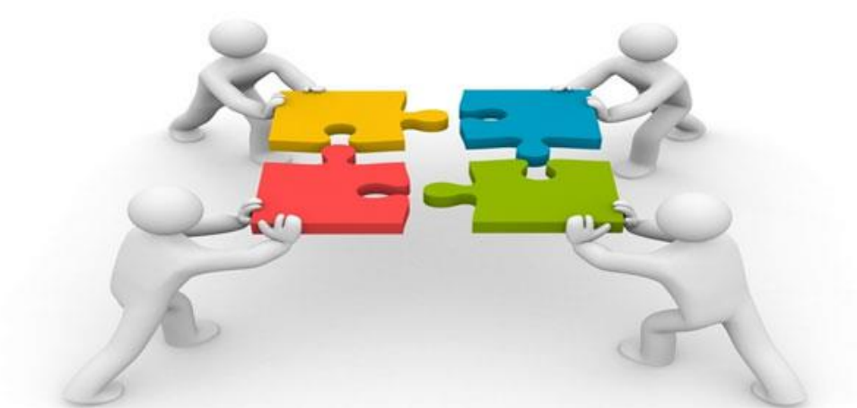
Εικόνα 3: Τοπική συμμετοχή