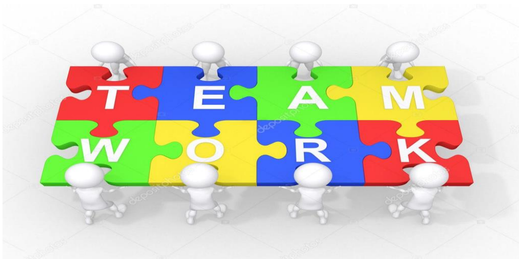
Εικόνα 1: Συνεργασία