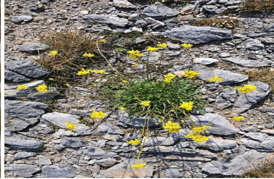
Coincya nivalis Ολύμπου