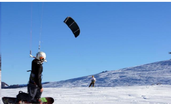
SnowKiting στο Μέτσοβο