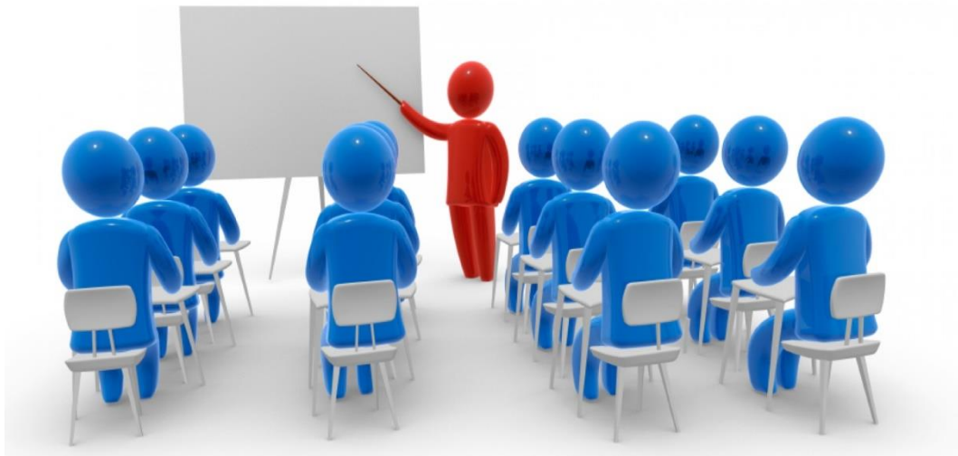
Εικόνα 2: Εκπαίδευση