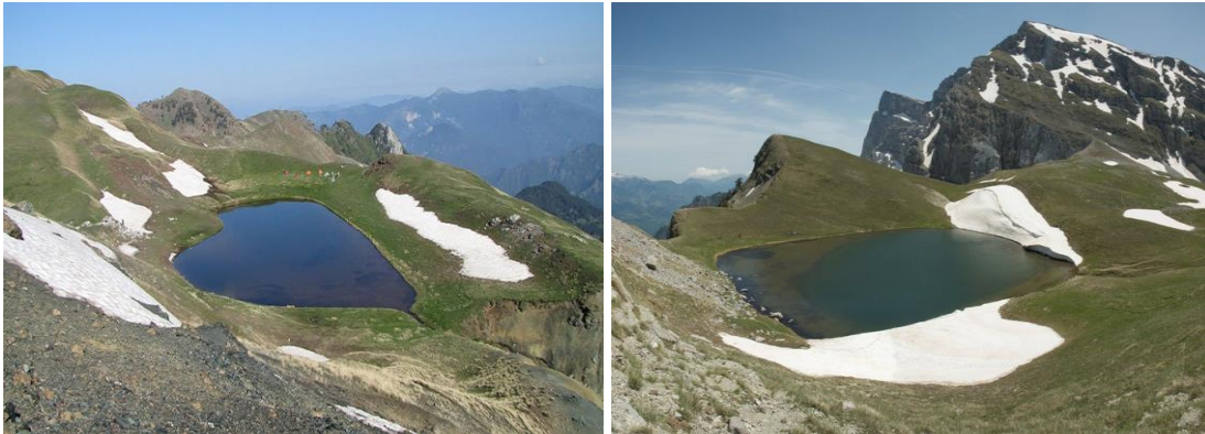
Δρακόλιμνη Σμόλικα (2200μ)