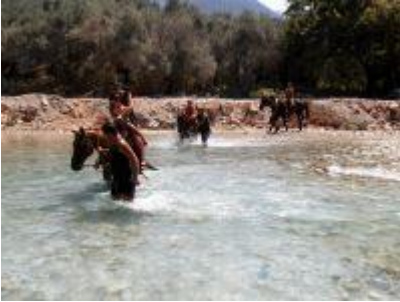
Ιππασία στον ποταμό Αχέροντα