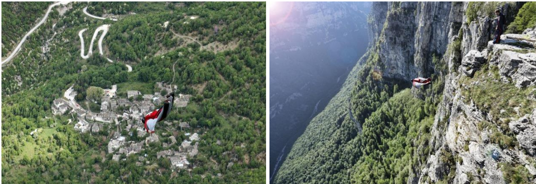
Wingsuit στο φαράγγι του Βίκου