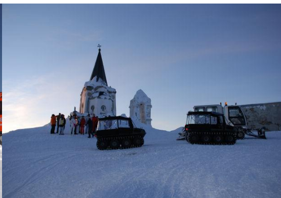
Snowcat στο Όρος Βόρας