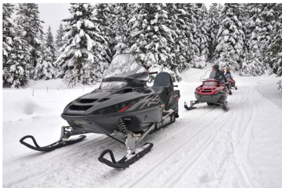
Snowmobile στο όρος Οίτη