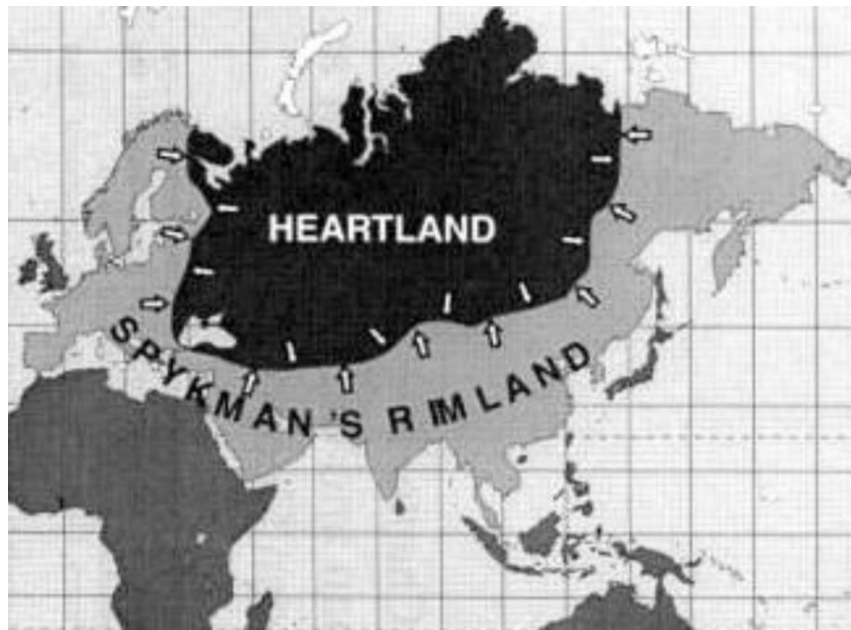
Εικόνα 1: Ο Δακτύλιος της Γης (Rimland) του Spykman

«Από τότε που οι ήπειροι άρχισαν να αλληλοεπηρεάζονται πολιτικά, πριν από πεντακόσια χρόνια περίπου, η Ευρασία ήταν το κέντρο της παγκόσμιας ισχύος». (Brzezinski 1997) Η Ρωσία, η Αυστροουγγαρία, η Γαλλία, η Οθωμανική Αυτοκρατορία, η Βρετανία και η Γερμανία, όλες τους ήθελαν να κυριαρχήσουν στην περιοχή αυτή που εκτείνεται από τις γαλλικές ακτές του Ατλαντικού μέχρι τον Περσικό Κόλπο και από την κινέζικη χερσαία μάζα μέχρι την Κεντρική Ασία, τη Μαύρη Θάλασσα, τα τουρκικά στενά και το Σουέζ. (Φούσκας 2003) Η περιοχή αυτή προσομοιώνεται με μια μεγάλη «σκακιέρα», επί της οποίας διεξάγεται ένας συνεχής ανταγωνισμός για παγκόσμια υπεροχή. Πάνω στην «σκακιέρα» εντοπίζονται γεωπολιτικά ενεργοί «παίκτες» (κράτη), οι οποίοι έχουν την ικανότητα και την θέληση να επηρεάσουν τις γεωπολιτικές εξελίξεις προς όφελός τους και γεωπολιτικοί παίκτες-κλειδιά, των οποίων η σπουδαιότητα δεν εξαρτάται τόσο από την ισχύ τους, όσο από την ευαίσθητη γεωγραφική τους θέση και τις ενδεχόμενες γεωπολιτικές ανακατατάξεις που δύναται να προκαλέσει η συμπεριφορά των γεωπολιτικά ενεργά κρατών. (Brzezinski 1997)