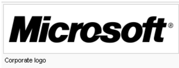
Εικόνα 1. Το λογότυπο της εταιρείας σήμερα

Η αρχική αποστολή της Microsoft ήταν «ένας υπολογιστής σε κάθε γραφείο και σε κάθε σπίτι, τρέχοντας το λογισμικό της Microsoft» και όπως φαίνεται σχεδόν εκπληρώθηκε. Η Microsoft κατέχει σημαντική θέση και σε άλλες αγορές, έχοντας στο ενεργητικό της το καλωδιακό τηλεοπτικό δίκτυο MSNBC, την ιστοσελίδα MSN και την εγκυκλοπαίδεια πολυμέσων της Microsoft Encarta. Η εταιρεία ακόμη διαθέτει στην αγορά και προϊόντα hardware όπως τα ποντίκια Microsoft καθώς επίσης και προϊόντα οικιακής ψυχαγωγίας όπως το Xbox, Zune και η TV MSN.