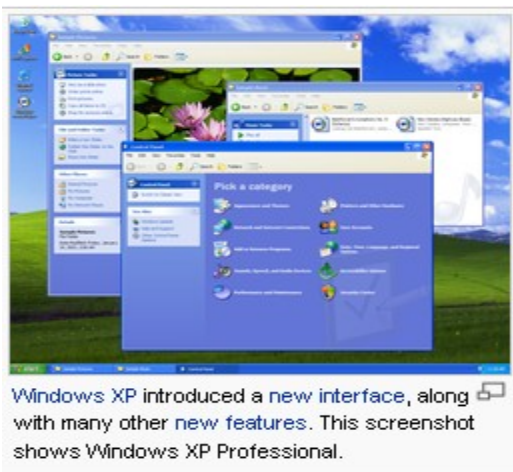
Εικόνα 3. Το περιβάλλον εργασίας των Windows XP

Το έτος 1998 ήταν σημαντικό στην ιστορία της Microsoft, με το Bill Gates να διορίζει το Steve Ballmer ως Πρόεδρο της Microsoft παραμένοντας ωστόσο ο ίδιος πρόεδρος και CEO. Ακόμη, κυκλοφόρησε μια αναβάθμιση στην οικιακή έκδοση των Windows, τα Windows 98 που περιελάμβαναν τον Internet Explorer 4.0. Το 2000, η Microsoft έθεσε σε κυκλοφορία τα Windows XP και το Office XP το 2001, οι εκδόσεις των οποίων στόχευαν να καλύψουν τα χαρακτηριστικά γνωρίσματα και των δύο γραμμών παραγωγής (Εταιρική και Οικιακή). Το 2007 η Microsoft εξέδωσε τα Windows Vista και το Microsoft Office 2007 και το 2008 επιδίωξε να εξαγοράσει τη Yahoo προκειμένου να ενισχύσει τη θέση της στην αγορά μηχανών αναζήτησης ιστού έναντι της Google. Η Yahoo απέρριψε την προσφορά ,υποστηρίζοντας ότι υποτιμά την επιχείρηση, και ως απάντηση η Microsoft την απέσυρε.