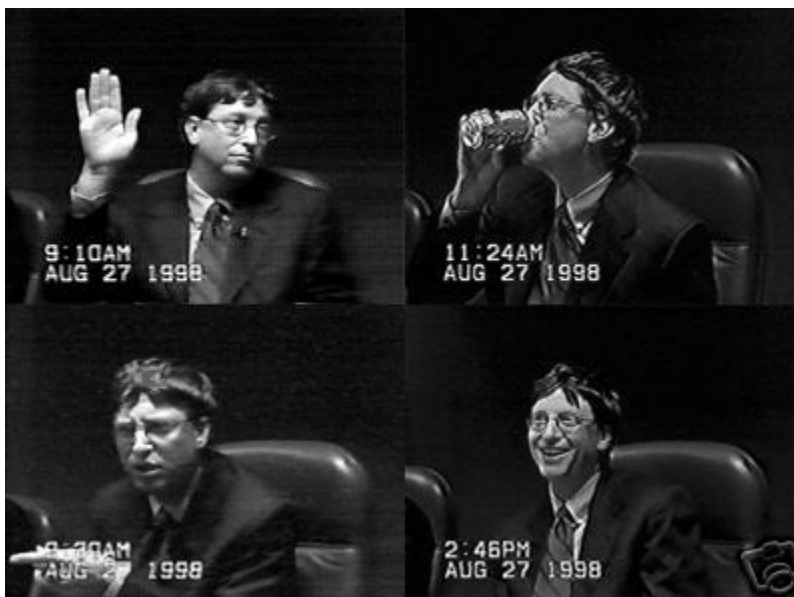
Εικόνα 4. Ο Bill Gates καταθέτει στη δίκη

Τα κυριότερα επιχειρήματα υπέρ της Microsoft ήταν ότι η συγχώνευση των Microsoft Windows και του Internet Explorer ήταν το αποτέλεσμα καινοτομίας και ανταγωνισμού, ότι τα δύο ήταν τώρα το ίδιο και αναπόσπαστο προϊόν και ότι οι καταναλωτές επωφελήθηκαν από αυτή την πρακτική, έχοντας δωρεάν τον Internet Explorer.