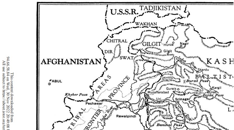
Σχήμα 1. Χάρτης διεκδικούμενης περιοχής

94.66.58.84 on Wed, 30 Nov 2022 20:49:08 All use subject to https://about.jstor.org/terms