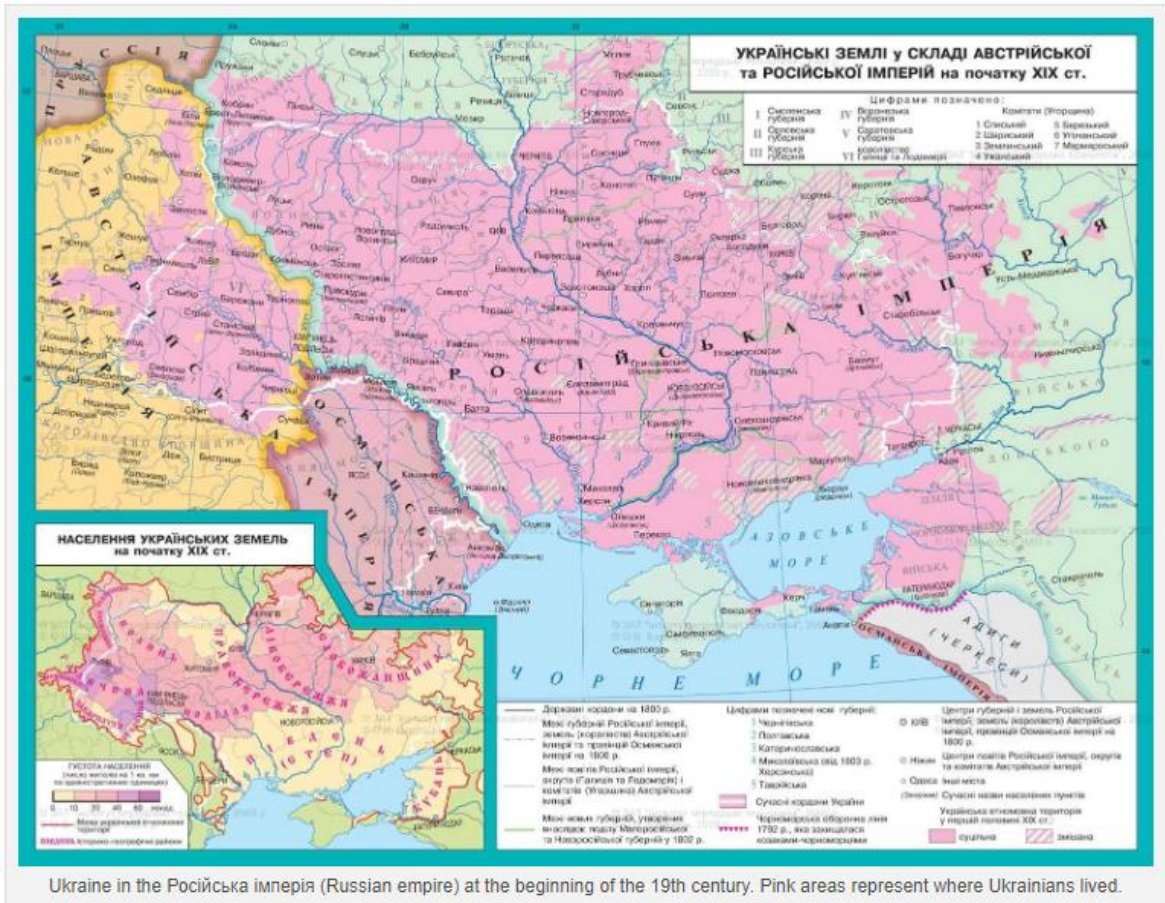
Εικόνα 1: Χάρτης της Ουκρανίας που άνηκε στη Ρωσική Αυτοκρατορία