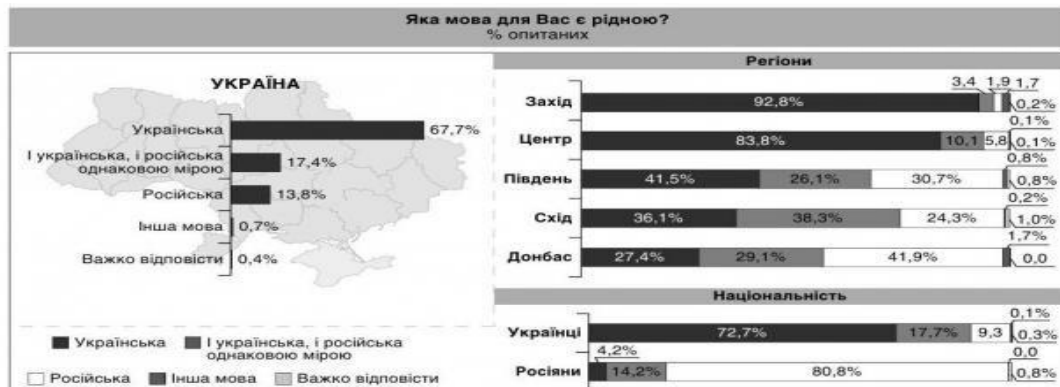
Εικόνα 3: Αποτελέσματα δημοσκόπησης 2017 για τη χρήση γλώσσας στην Ουκρανία

Το 2017, περισσότερα από τα δύο τρίτα των Ουκρανών πολιτών ισχυριζόταν, ότι τα ουκρανικά είναι μητρική τους γλώσσα (Εικόνες 3 & 4). Ακόμη και στις ανατολικές περιοχές, ένας πλουραλισμός είναι δίγλωσσος στα ουκρανικά και τα ρωσικά. Η μετατόπιση αντικατοπτρίζει τόσο την κρατική πολιτική, όπως στην εκπαίδευση, με το νόμο του 2017 (Kulyk 2018), όσο και τις ατομικές αποφάσεις.