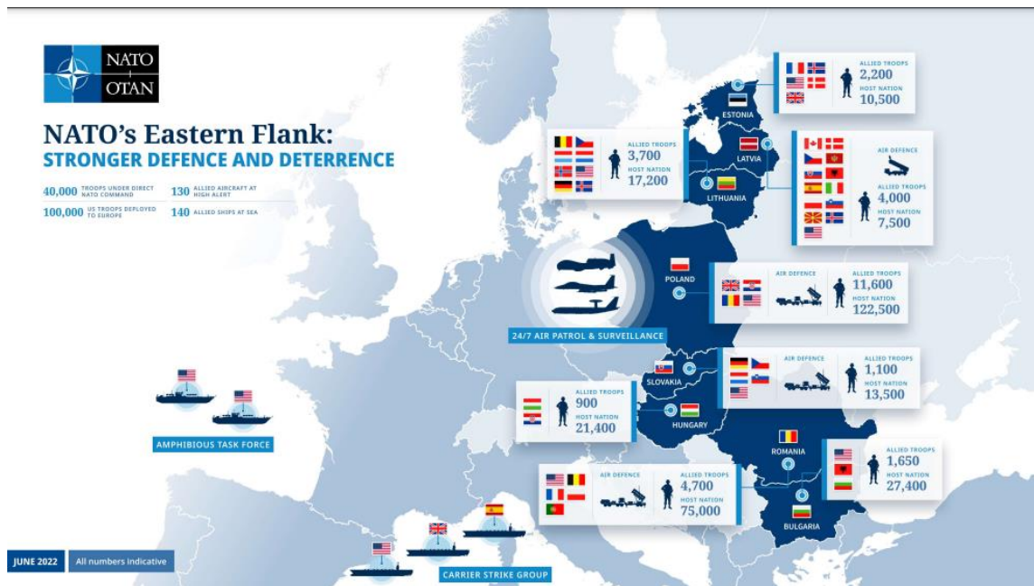
Εικόνα 5: Στρατεύματα του NATO στην Ανατολική Ευρώπη, Ιούλιος 2022

Από την πρώτη εισβολή της Ρωσίας στην Ουκρανία το 2014, το NATO έχει ανανεώσει την εστίασή του, στην εδαφική άμυνα, αποτρέποντας τη ρωσική επιθετικότητα (NATO 2022στ), μεταξύ άλλων μέσω της ενισχυμένης παρουσίας (Enhanced Forward Presence - EFP) τεσσάρων πολυεθνικών Σχηματισμών Μάχης (Battle Groups) που βρίσκονται στα κράτη της Βαλτικής (Εσθονία, Λετονία και Λιθουανία) και την Πολωνία (NATO 2022ζ) (Εικόνα 5).