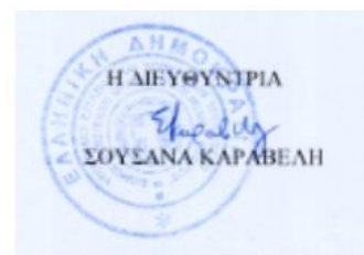
Εικόνα 9: Άδεια φωτογράφισης τεκμηρίων.

Είμαστε στη διάθεσή σας για περαιτέρω διευκρινήσεις.