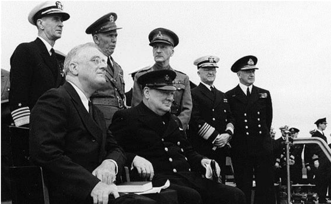
Εικόνα 3: Ουίνστον Τσώρτσιλ και Φρανκλίνος Ρούζβελτ κατά την ημέρα υπογραφής της Χάρτας