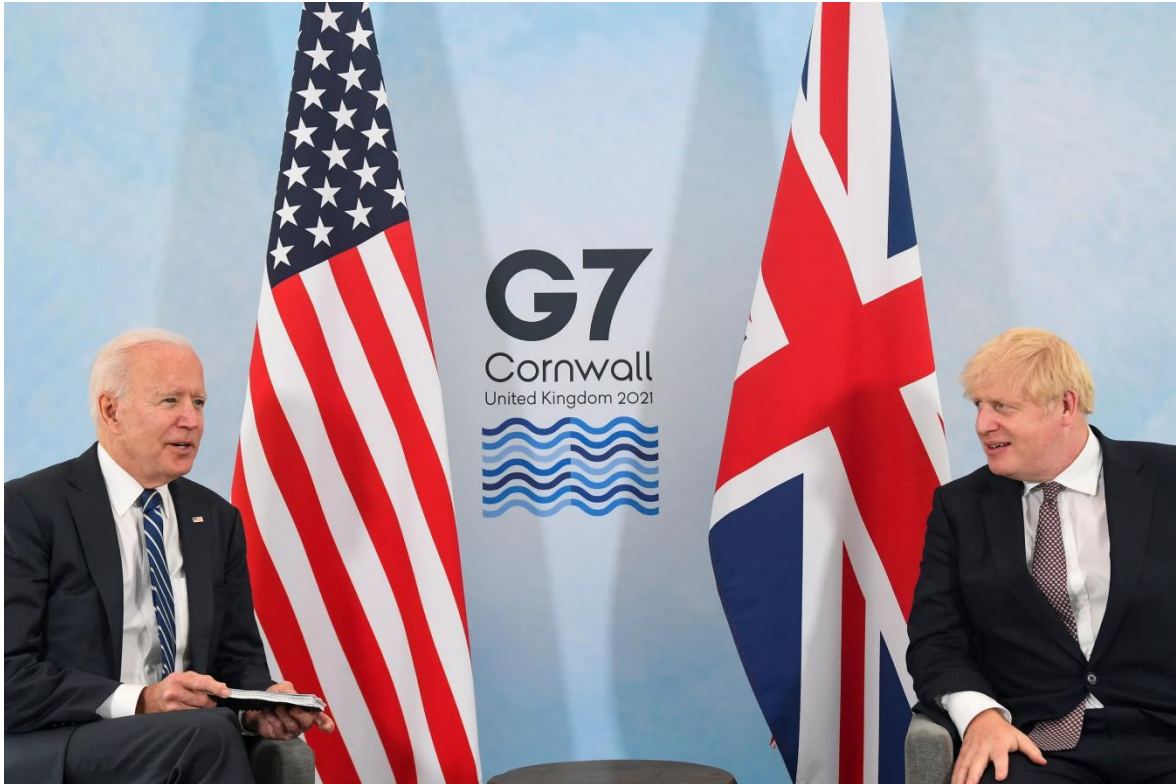
Εικόνα 6: Τζο Μπάιντεν και Μπόρις Τζόνσον κατά τη διάρκεια της Συνόδου G7 στην Κορνουάλη