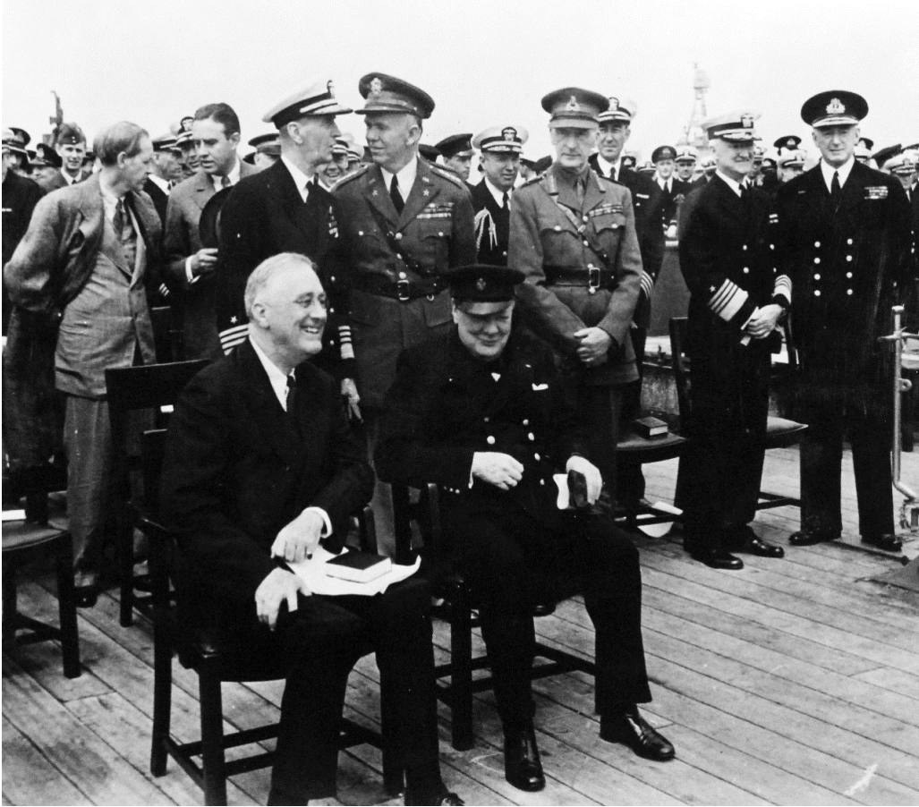
Εικόνα 2: Ουίνστον Τσώρτσιλ και Φρανκλίνος Ρούζβελτ κατά την ημέρα υπογραφής της Χάρτας