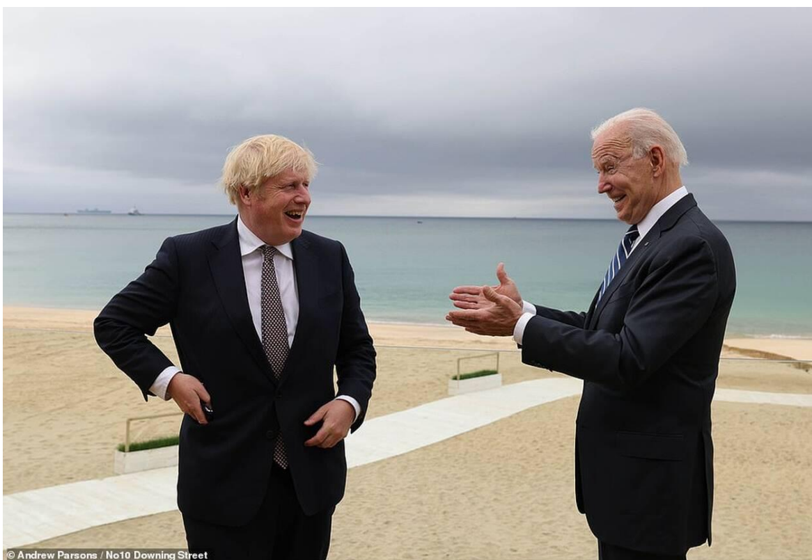
Εικόνα 4: Τζο Μπάιντεν και Μπόρις Τζόνσον κατά τη διάρκεια της Συνόδου G7 στην Κορνουάλη

Στις εικόνες που ακολουθούν παρουσιάζεται το κείμενο της Νέας Χάρτας του Ατλαντικού, καθώς και φωτογραφικό υλικό με τους δύο ηγέτες.