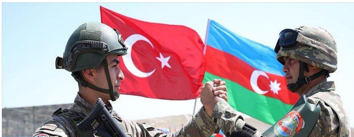
Εικόνα 3 - Η Τουρκία είχε Ενεργό Στρατιωτικό Ρόλο στον Πόλεμο του Ναγκόρνο - Καραμπάχ το 2020.

τουρκική πλευρά δεν αποδέχεται τον συγκεκριμένο όρο (Νταβούτογλου, 2010, σ. 207). Το 2019, το Κογκρέσο των ΗΠΑ ψήφισε υπέρ της επίσημης αναγνώρισης της Γενοκτονίας των Αρμενίων η οποία αναγνώριση πραγματοποιήθηκε από τον σημερινό πρόεδρο των ΗΠΑ, Τζο Μπάιντεν.