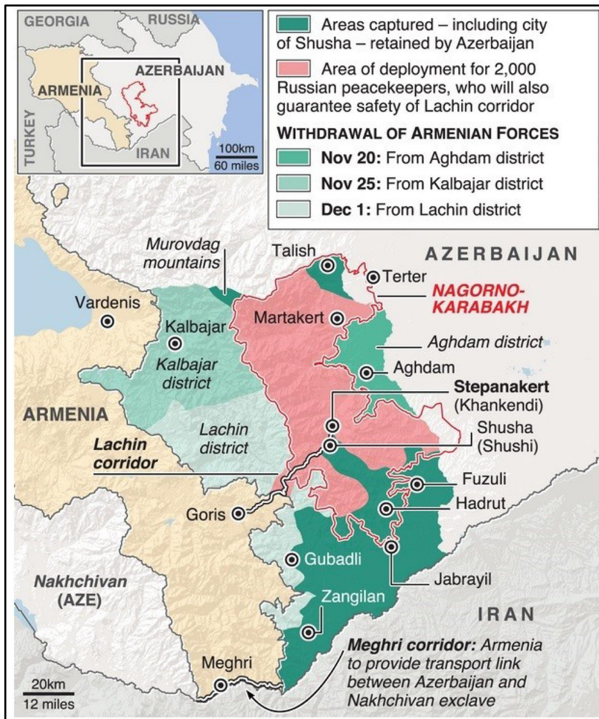
Χάρτης 3 - Χάρτης Καταστάσεως στο Ναγκόρνο - Καραμπάχ μετά την 10η Νοεμβρίου 2020 και το πέρας του πολέμου των 44 ημέρων (Μάζης, 2020)