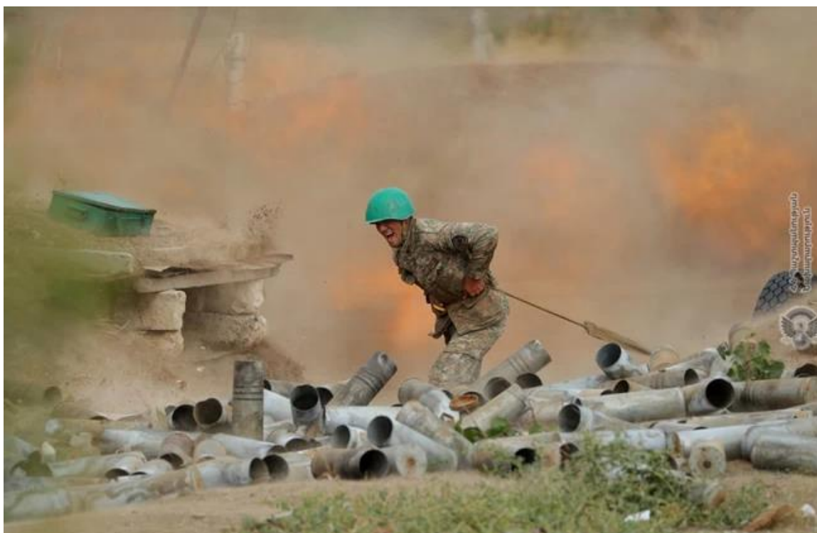
Εικόνα 2 - Χαρακτηριστική Φωτογραφία της σφοδρότητας των Συγκρούσεων στο Ναγκόρνο – Καραμπάχ.

Ωστόσο, εκ του αποτελέσματος, παρατηρείται το γεγονός ότι ενεχόταν ο κίνδυνος προφανούς παρερμηνείας των συγκεκριμένων αυτών εξελίξεων καθώς επήλθε τελικά εκ νέου σύγκρουση μεταξύ Αρμενίας και Αζερμπαϊτζάν. Καθίσταται προφανές ότι δεν προωθήθηκε επαρκώς η καθιέρωση του διαλόγου μεταξύ των Αρμενικών και των Αζερικών κοινοτήτων του ΝΚ από τους διάφορους εμπλεκόμενους οργανισμούς και ιδιαίτερα τον ΟΑΣΕ. Η αποτυχία αυτή, σε συνάρτηση με την μονοδιάστατη συμπεριφορά των κυβερνήσεων των δύο χωρών οδήγησε σε ένα νέο κύμα αντιπαλοτήτων, προκλήσεων, διασυνοριακών επεισοδίων και εντέλει στον πόλεμο του 2020.