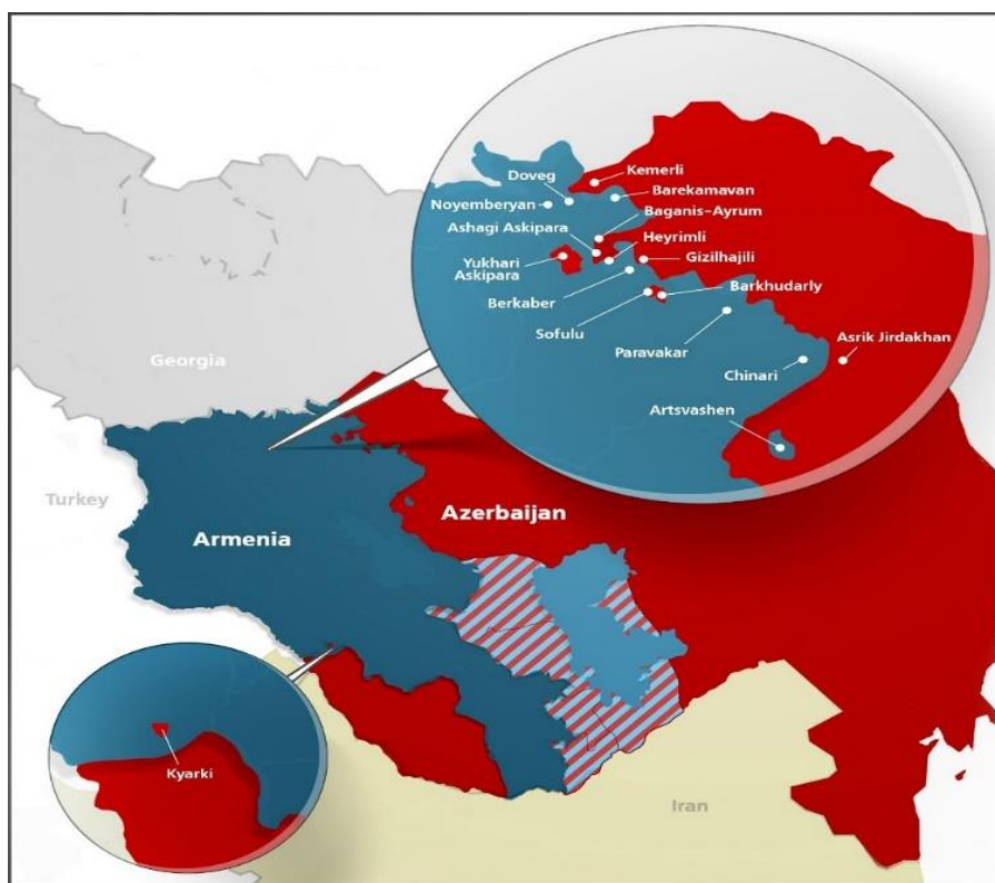
Εικόνα 8 - Χάρτης Αρμενικών - Αζερικών Περίκλειστων Περιοχών (Θύλακες). (Μενεσιάν, 2021)

Το Μπακού με τις ενέργειές του, όπως γίνεται αντιληπτό, στοχεύει μεταξύ άλλων στην εξασφάλιση του λεγόμενου «Διαδρόμου του Zangezur» ο οποίος θα περνά μέσα από την Αρμενική επαρχία Syunik και θα συνδέει το Αζερμπαϊτζάν με το Ναχιτσεβάν καθώς και στη σύναψη νέας συμφωνίας που θα αφορά την οριοθέτηση και επαναχάραξη των Αζερο - Αρμενικών συνόρων, προκειμένου να επιστρέψουν οι Αζέρικοι θύλακες στο Αζερμπαϊτζάν μετά την κατάληψή τους από την Αρμενία το 1992. Επιπλέον, στοχεύει στην εξαίρεση του ΝΚ από οποιοσδήποτε μελλοντικές συνομιλίες και διαπραγματεύσεις με την Αρμενία, αφού όπως υποστηρίζει η επίλυση του ζητήματός αυτού επήλθε με το τέλος του πολέμου το φθινόπωρο του 2020.