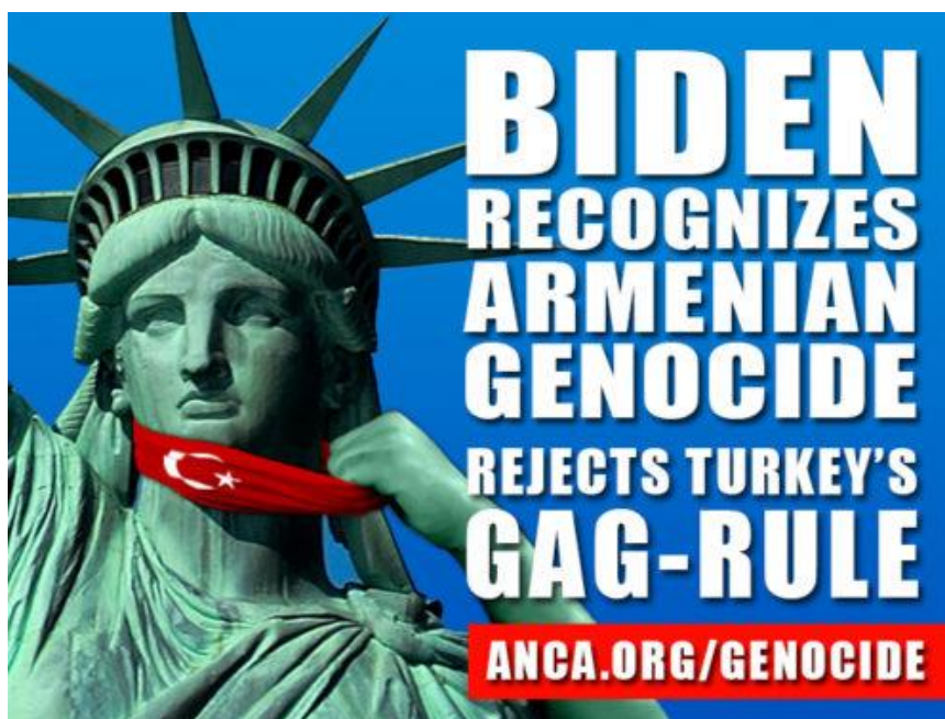
Εικόνα 10 - Αναγνώριση της Γενοκτονίας των Αρμενίων από τον Πρόεδρο Biden και τις ΗΠΑ.

Οι ΗΠΑ, πιθανόν να μην αποθάρρυναν την τουρκική στρατιωτική υποστήριξη του Αζερμπαϊτζάν, προκειμένου να εξαναγκαστεί η Ρωσία να βοηθήσει την Αρμενία, στα πλαίσια των συμφωνιών του CSTO. Η Ρωσία όμως χειρίστηκε το θέμα εξόχως διπλωματικά, αφού πιθανή παρέμβαση θα επέφερε οξεία διπλωματική αντιπαράθεση με την Τουρκία και απώλεια της επιτευχθείσας επιρροής της στο Αζερμπαϊτζάν. Κάτι τέτοιο θα εξυπηρετούσε τις ΗΠΑ, που θα έβλεπαν το τέλος της νεοσύστατης «συμμαχίας» Τουρκίας – Ρωσίας και την επιστροφή της Άγκυρας στις «δυτικές αγκάλες».