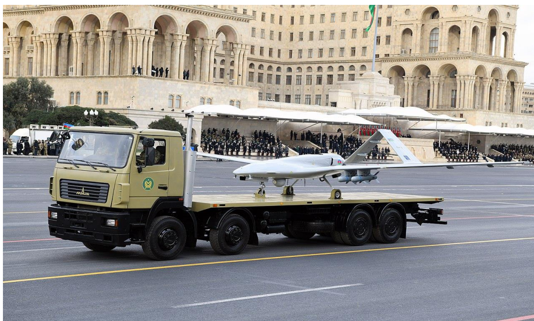
Εικόνα 13 - Το Τουρκικό UAV, Bayraktar TB2, κατά την παρέλαση της «Νίκης» τον Δεκέμβριο 2020, στο Μπακού.

πολύ ευάλωτα στις αντιαεροπορικές άμυνες που έχουν σχεδιαστεί για να τα αντιμετωπίζουν. Βέβαια, οι ένοπλες δυνάμεις των Αρμενίων δεν κατείχαν αμυντικά συστήματα τα οποία θα μπορούσαν να αποτελέσουν το αντίμετρο κατά της δράσης των UAVs. Το μεγαλύτερο μέρος της αντιαεροπορικής άμυνας της Αρμενίας αποτελείτο από παρωχημένα συστήματα της σοβιετικής εποχής, όπως τα 2K11 KRUG μέσης εμβέλειας, 9K33 OSA μικρής εμβέλειας, 2K12 KUB και 9K35 STRELA-10 εναντίον ελικοπτέρων κυρίως. Τα TB2 πετούσαν αρκετά ψηλά (μέγιστο ύψος πτήσης 28.000 πόδια και επιχειρησιακό 18.000 πόδια) και εξουδετέρωναν αυτά τα συστήματα ακόμη και αν ανιχνεύονταν. Τα συστήματα ηλεκτρονικού πολέμου POLYE-21 115 που προμηθεύτηκε η Αρμενία από τη Ρωσία διέκοψαν τις πτητικές επιχειρήσεις των UAVs του Μπακού, αλλά μόνο για τέσσερις ημέρες.