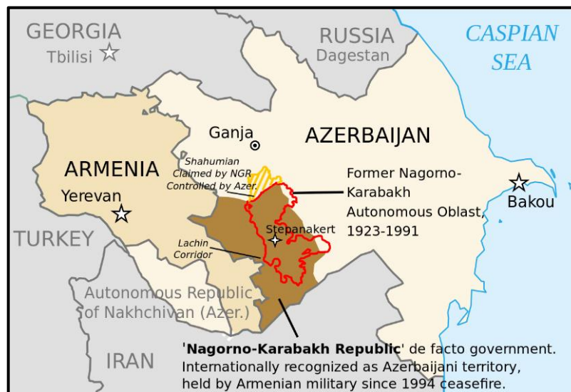
Χάρτης 1 - Χάρτης Καταστάσεως στο Ναγκόρνο - Καραμπάχ μετά την κατάπαυση του πυρός τον Μάιο 1994 (en.wikipedia.org, 2021)