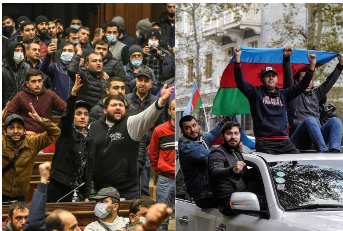
Εικόνα 6 - Οι αντιδράσεις των λαών των δύο χωρών μετά το πέρας του Πολέμου του 2020.

της Αρμενίας. Ουσιαστικά, η ζωή των πολιτών επηρεαζόταν από τη σύγκρουση αναφορικά με το Αρτσάχ και των γενικών αρχών όπως αυτές χαρακτηριστικά ηχούσαν σαν ευήκοες προεκτάσεις της πολιτικής κουλτούρας. Η αντίληψη του κοινού της Αρμενίας συσχετιζόταν άμεσα με τις επιδιώξεις των πολιτικών κομμάτων, που άλλοτε συμπορεύονταν με τη δράση της ΟτΜ ενώ σε άλλες περιπτώσεις, η αντιπολίτευση τη χαρακτήριζε αναποτελεσματική σε σχέση με τις διαδικασίες διαμεσολάβησης. Παράλληλα, η οποιαδήποτε πρόκληση ή ενδεχόμενη ένταση στρατιωτικής φύσεως από πλευράς Αζερμπαϊτζάν οδηγούσε αναντίλεκτα το Ερεβάν στην εκδήλωση και εφαρμογή σκληρής πολιτικής προκειμένου να ανταπεξέλθει τόσο των κρίσιμων ερεθισμάτων στην εξωτερική πολιτική, όσο και των δημιουργηθείσων εγχώριων ανησυχιών. 70