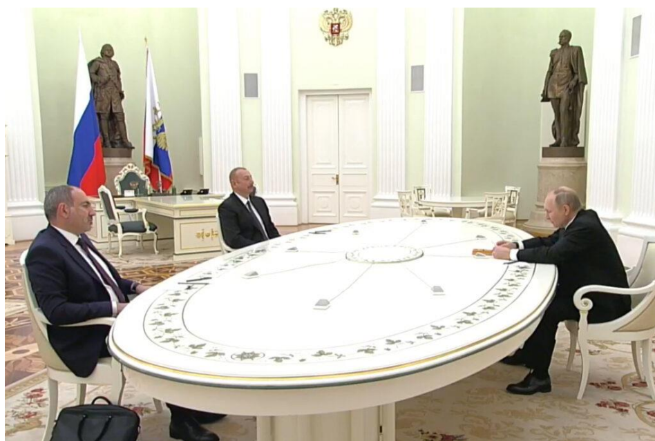
Εικόνα 4 - Η Πρώτη Συνάντηση των Ηγετών της Ρωσίας, Αζερμπαϊτζάν και Αρμενίας μετά τον πόλεμο του 2020.

του πυρός το οποίο θα στελεχώνεται από ρωσικές δυνάμεις, ενώ διάφορες αναφορές που είδαν το φως της δημοσιότητας ενέπλεξαν τη συμμετοχή και τουρκικών δυνάμεων (Fraser, 2020). Επίσης, τα συνοριακά στρατεύματα της Ρωσικής Ομοσπονδιακής Υπηρεσίας Ασφαλείας (FSB – Federal Security Service) θα είναι υπεύθυνα για την ελεύθερη κυκλοφορία μεταξύ του Αζερμπαϊτζάν και του θύλακα του Ναχιτσεβάν. Μετά την κατάπαυση του πυρός, αναφέρθηκαν ορισμένες περιοδικές συγκρούσεις μεταξύ δυνάμεων του Αζερμπαϊτζάν και των Αρμενίων/μαχητών του ΝΚ. Αυτές οι συγκρούσεις είχαν ως αποτέλεσμα μερικά θύματα και εκατέρωθεν συλλήψεις στρατιωτικού προσωπικού. 54 Οι δύο πλευρές έχουν παράλληλα προβεί και σε ανταλλαγές κρατουμένων και αιχμαλώτων πολέμου. 55