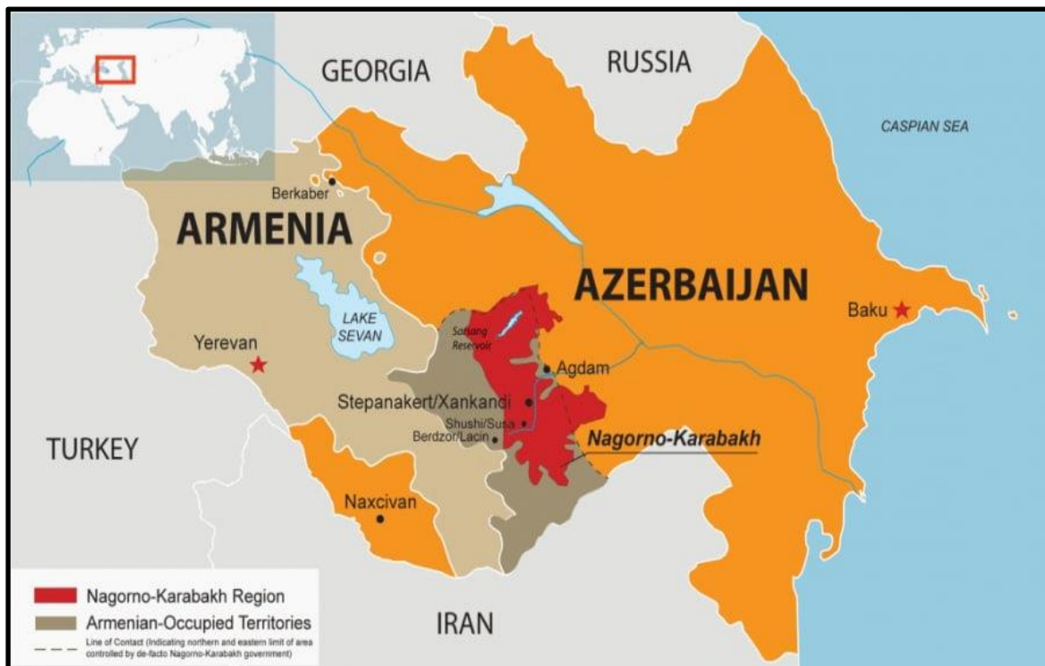
Εικόνα 1 - Χάρτης της Αρμενίας, του Αζερμπαϊτζάν και της διαφιλονικούμενης περιοχής του Ναγκόρνο - Καραμπάχ.

περισσότερων από 1.000.000, ενώ οι οικονομίες των δύο χωρών πλήγηκαν ανεπανόρθωτα (Μανώλη, 2020, σ. 3). Οι εκτοπισμένοι αποτελούνταν από 500.000 περίπου Αζέρους που προέρχονταν από περιοχές γύρω από το ΝΚ, 185.000 Αζέρους που αναγκάστηκαν να εγκαταλείψουν την Αρμενία, και πάνω από 350.000 Αρμένιους προερχομένους από το Αζερμπαϊτζάν (Αλεξόπουλος, 2001, σσ. 63-64).