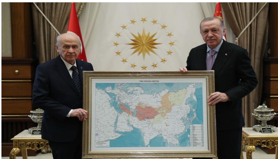
Εικόνα 9 - Παρουσίαση του προκλητικού χάρτη του «Τουρκικού κόσμου» από τον Τούρκο πρόεδρο, Ερντογάν και τον κυβερνητικό του εταίρο, Μπαχτσελί.

Φυσικά η αυξανόμενη επιρροή της Τουρκίας στην περιοχή εγείρει σοβαρά ερωτήματα σχετικά με την εξελισσόμενη και δυναμική σχέση μεταξύ Άγκυρας και Μόσχας, η οποία περιλαμβάνει στοιχεία τόσο αντιπαλότητας όσο και συνεργασίας. Αυτή η δυναμική σχέση λειτουργεί εντός ενός ευρύτερου πλαισίου που περιλαμβάνει επίσης τις συνεχιζόμενες συγκρούσεις στη Λιβύη και τη Συρία, τις πωλήσεις ρωσικών όπλων τελευταίας τεχνολογίας (αντιαεροπορικό σύστημα S400) στην Τουρκία, την αυξανόμενη προβολή ισχύος της Τουρκίας και την ανανεωμένη τουρκική συνεργασία με την Ουκρανία. Συμπερασματικά αναφέρεται ότι στον αντίποδα, αυτό θα μπορούσε να έχει αρνητικές συνέπειες στις σχέσεις των ΗΠΑ τόσο με τη σύμμαχό τους στο NATO, Τουρκία όσο και με τη Ρωσία.