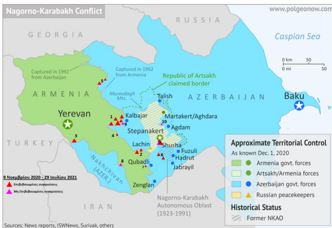
Εικόνα 7 - Χάρτης των Συγκρούσεων στο Ναγκόρνο - Καραμπάχ μετά τη Συμφωνία της 9 ης Νοεμβρίου 2020.

Όσον αφορά την κυρίως περιοχή του ΝΚ, το Αζερμπαϊτζάν προέβη σε επίθεση και κατάληψη των χωριών Khitsaberd και Hin Taher (10 η Δεκεμβρίου 2020) ενώ εξαπέλυσε πυρά στα χωριά Shosh και Mkhitarashen καθώς και στο Stepanakert (Πρωτεύουσα του Artsakh) την 23 η Απριλίου 2021.