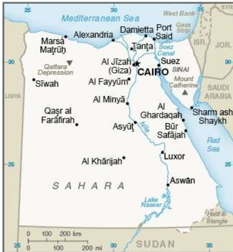
Figure 1, χάρτης της Αιγύπτου