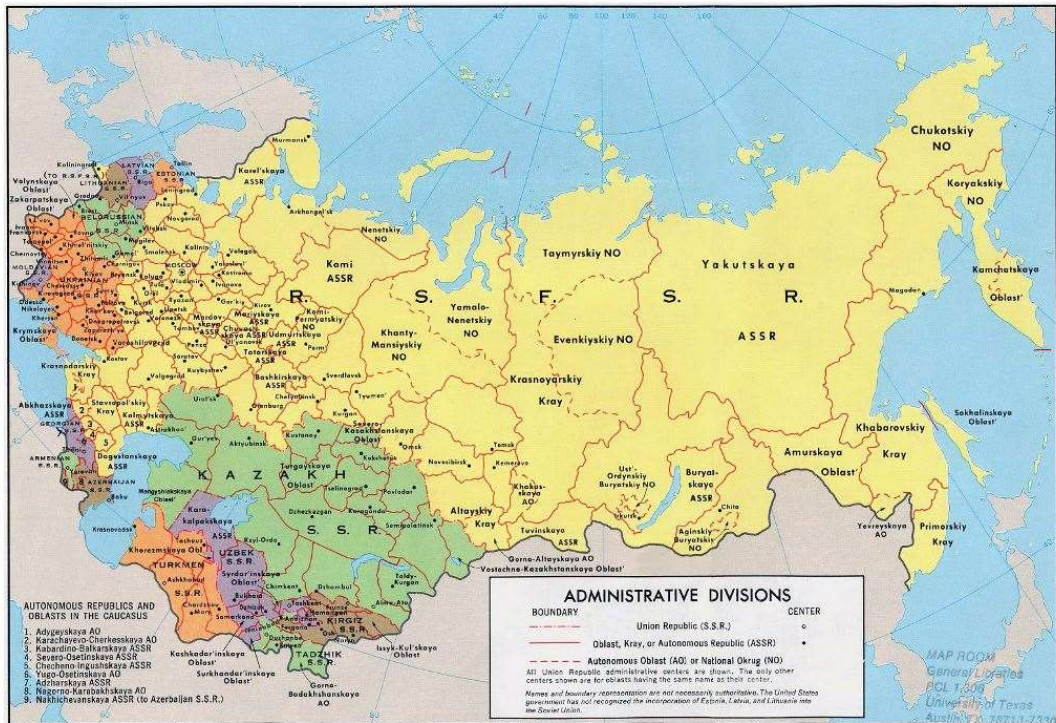
Figure 3, χάρτης της ΕΣΣΔ, πηγή Maps of U.S.S.R.