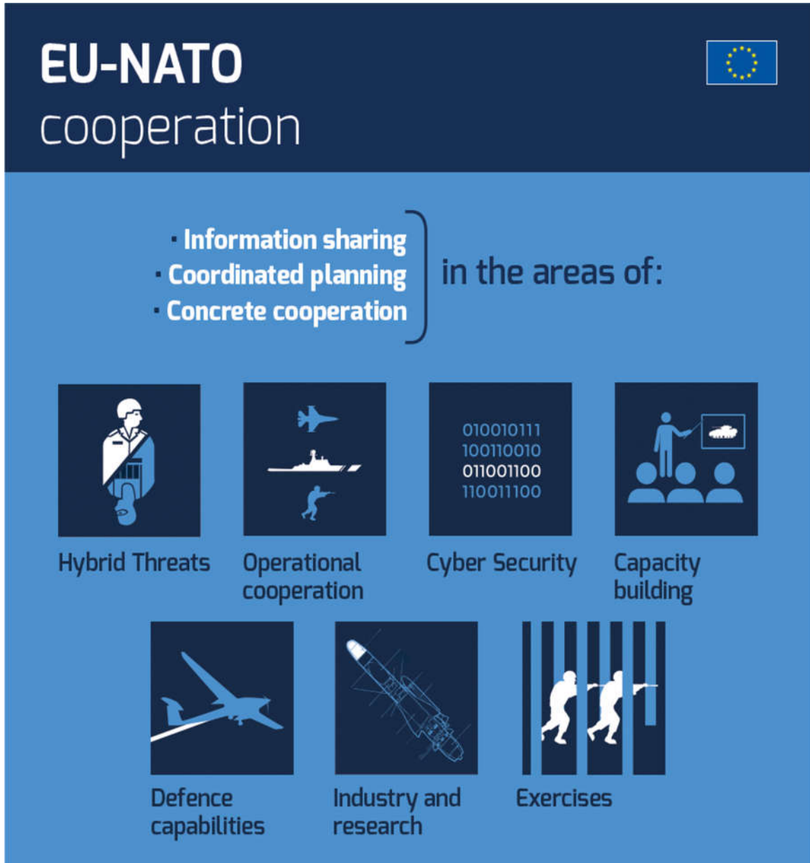
Εικόνα 1: EU – NATO Cooperation https://eeas.europa.eu/headquarters/headquarters-homepage/48265/eu-and-nato-defence-europe-coherent-complementary-and-interoperable_en