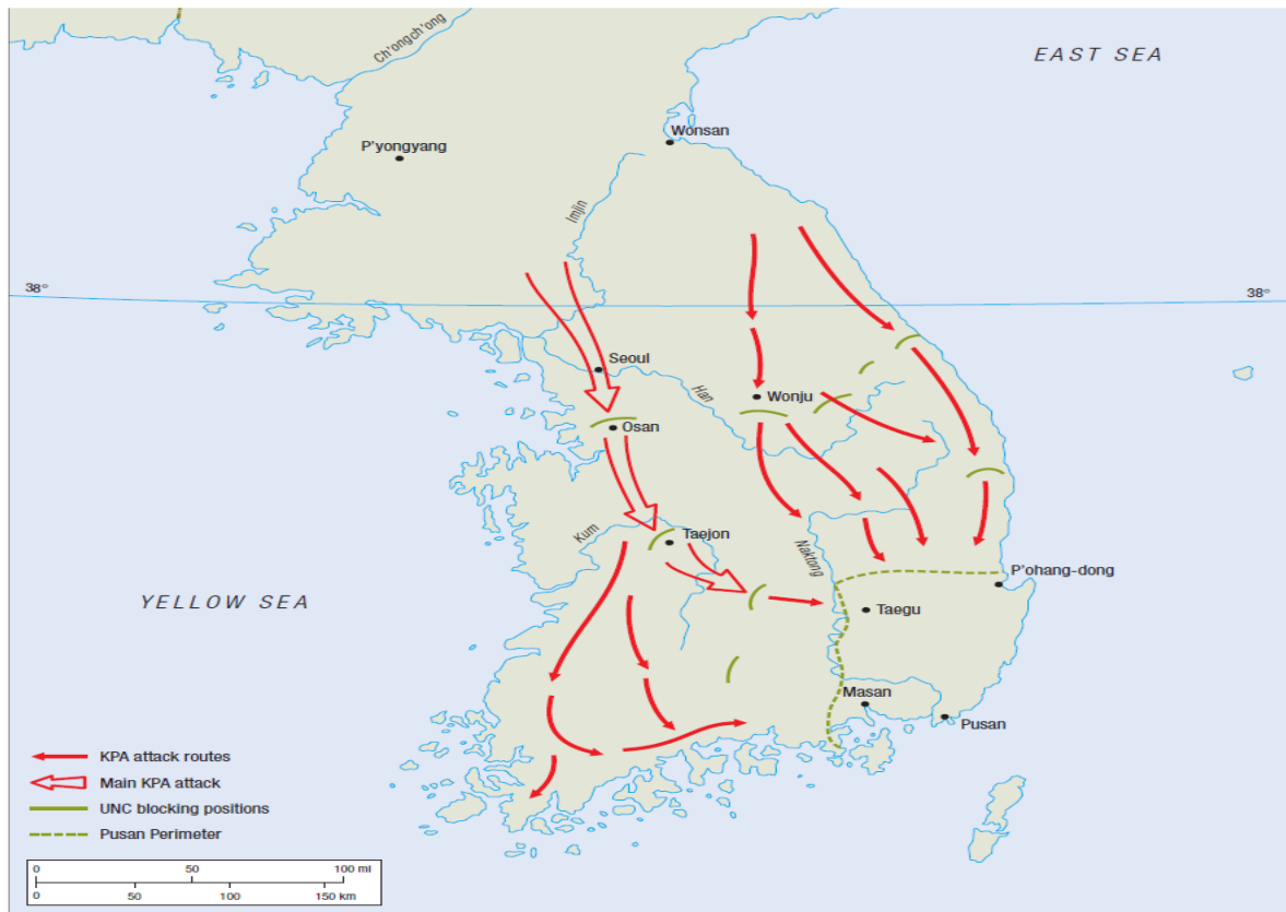
Εικόνα 3: Η περίμετρος του Pusan

Pohang και σε συνδυασμό με την 6 η Μεραρχία από τα νοτιοανατολικά να απειλήσει το Pusan.