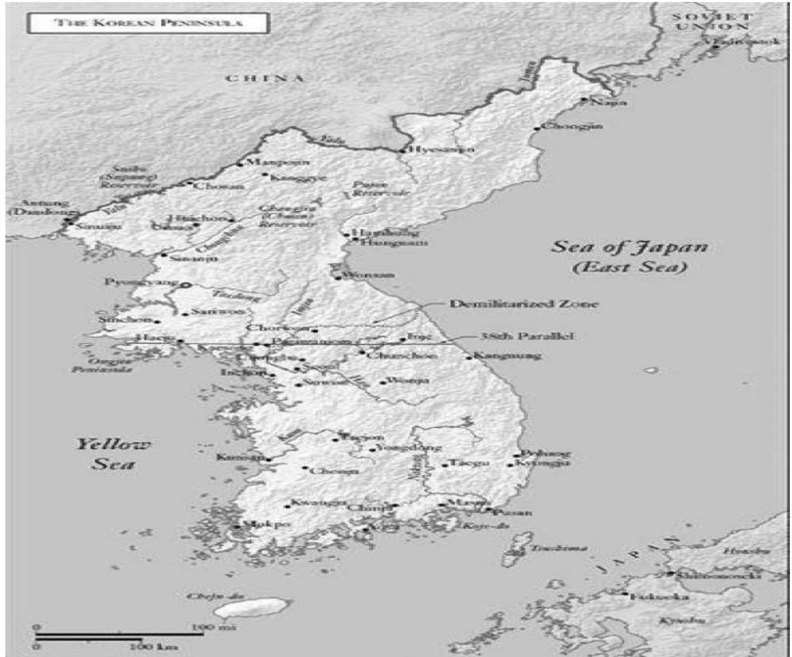
Εικόνα 1: Η Χερσόνησος της Κορέας

Στον Πόλεμο στην Κορέα τα Ηνωμένα Έθνη ή πιο ρεαλιστικά οι ΗΠΑ ανέπτυξαν μια τεράστια δύναμη για να νικήσουν το μαζικό στρατό των αντιπάλων και ως εκ τούτου πολλά ήταν τα διδάγματα για αμφότερα τα στρατόπεδα. Για παράδειγμα μελέτες του Υπουργείου Άμυνας των ΗΠΑ έδειξαν ότι κατά την διάρκεια του πολέμου στην Κορέα, όπως ακριβώς και κατά τη διάρκεια του Β ΠΠ, οι χαμηλότερες κοινωνικοοικονομικές ομάδες των ΗΠΑ «σήκωσαν» το κύριο βάρος του πολέμου και κυρίως τη στελέχωση των Μονάδων του Πεζικού. Στην Κορέα, οι κομμουνιστές είχαν την ευκαιρία να μάθουν πολλά για τα όρια της δυτικής υπομονής και τις δυσκολίες διατήρησης του λαϊκού ενθουσιασμού.