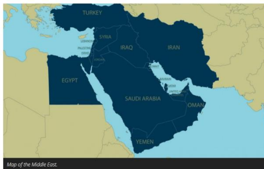
Εικόνα 1. Χάρτης χωρών Μέσης Ανατολής

και της κοινωνίας των πολιτών εξακολουθεί να είναι διφορούμενος 47 . Ως εκ τούτου, ο όρος 'Μέση Ανατολή' είναι ευρύς και δεν χρησιμοποιείται πάντα για να περιγράψει την ίδια επικράτεια. Περιλαμβάνει συνήθως τις αραβικές χώρες από την Αίγυπτο ανατολικά μέχρι τον Περσικό Κόλπο, συν το Ισραήλ και το Ιράν. Η Τουρκία θεωρείται μερικές φορές μέρος της Μέσης Ανατολής, μερικές φορές μέρος της Ευρώπης. Μερικές φορές η Μέση Ανατολή περιλαμβάνει και τη Βόρεια Αφρική 48 . Σύμφωνα με το World Atlas, η Μέση Ανατολή είναι ένας όρος που χρησιμοποιείται γενικά για την αναφορά στην περιοχή που βρίσκεται μεταξύ της Ασίας και της αφρικανικής ηπείρου. Θεωρείται μια διηπειρωτική ζώνη. Οι χώρες αυτής της περιοχής μοιράζονται πολλούς παράγοντες, συμπεριλαμβανομένων των εθνοτικών ομάδων, των γεωγραφικών χαρακτηριστικών, των θρησκευτικών πεποιθήσεων και της πολιτικής ιστορίας. Η Μέση Ανατολή περιλαμβάνει επίσης την Αίγυπτο, μια χώρα της Βόρειας Αφρικής, λόγω των δημογραφικών της, της εγγύτητας και της κοινής ιστορίας.