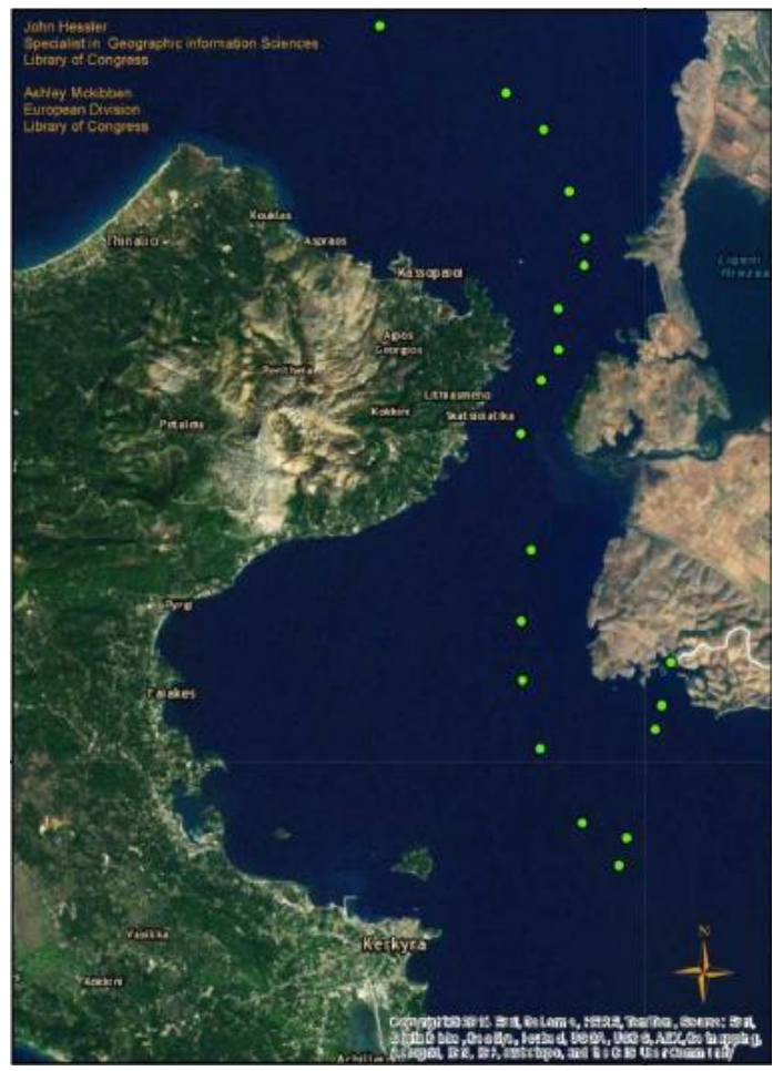
Εικόνα Νο.3 - Η οριοθέτηση της εδαφικής θάλασσας μεταξύ Ελλάδας και Αλβανίας στην ευθεία μεταξύ Αλβανίας και Κέρκυρας. Η επίδραση του νησιού Barchetta.